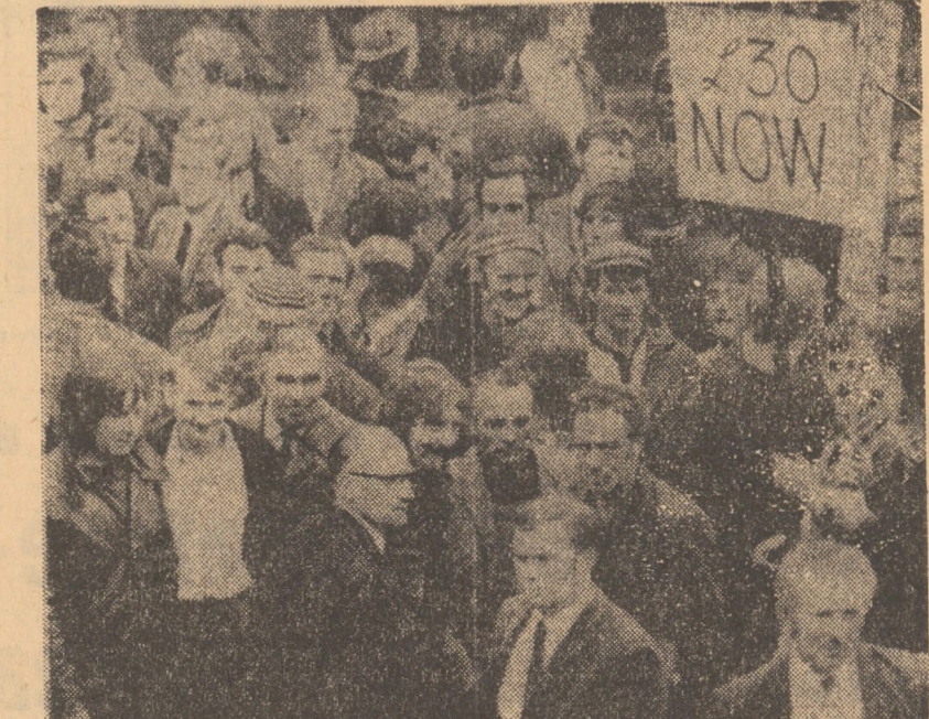
ANGLIA. În Foto: demonstrația a muncitorilor greviști din construcții la Manchester

Ministrul de externe al Libanului, Khalyl Abouhamad, a reliefat interdependența dintre dezarmare și dezvoltare — două din obiectivele principale ale Națiunilor Unite. Imense resurse sînt cheltuite în fiecare an pentru înarmări — a spus reprezentantul libanez — și dacă o parte oricît de mică a lor ar putea fi alocată dezvoltării, aceasta ar contribui în mod serios la rezolvarea problemelor economice și sociale ale țărilor în curs de dezvoltare. Ministrul libanez s-a ocupat pe larg de evoluția situației din Orientul Apropiat, care, a precizat el, reprezintă o amenințare cres-