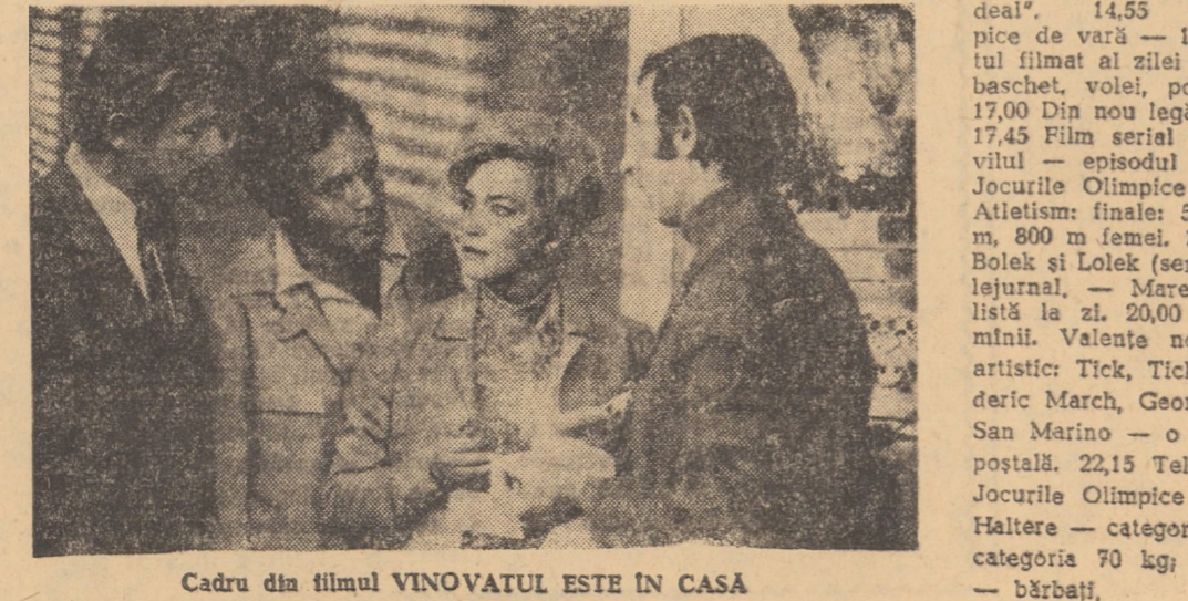
Cadru din filmul VINOVAȚUL ESTE ÎN CASĂ

SIBIU: PACEA: Jocul de-a moartea (orele 9,00; 11,30; 15,00; 18,00; 20,30); ARTA: Inima e un vinător singuratic (orele 9,30; 12,00; 15,30; 18,00; 20,30); TINERETULUI: Odiseea generalului Jose (orele 10,00; 12,00; 14,30; 16,30; 20,30); INDEPENDENȚA: Războiul sîntului (orele 11,00; 14,30; 16,30; 18,30; 20,30); 7 NOIEMBRIE: Ultimul mohican (orele 10,00; 14,00; 16,00; 18,00 și 20,00).