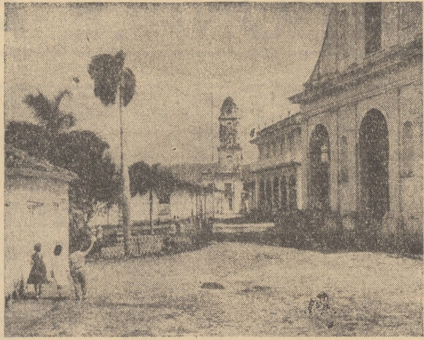
CUBA. — Atunci când Cristofor Columb a descoperit Cuba în 27 oct. 1492, nu și-a imaginat că insula, asemănătoare ca formă unui uriaș aligator verde plutind pe apele mării Caraibilor, va fi presărată peste sute de ani de o mulțime de orașe pitorești.

Budapesta 21. — Corespondentul Agerpres, Alexandru Pintea, transmite: La posturile ungare de radio „Kossuth” și „Petőfi” a început, luni, săptămâna culturii românești, organizată cu ocazia sărbătorii naționale a României. Programul cuprinde ciclul de emisiuni muzicale, însoțit de piese simfonice și folclorice.