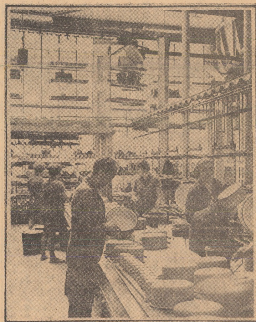
Vasele emalate, realizate de uzina „Emallul roșu” Mediaș, se remarcă astăzi printr-o gamă variată de noi sortimente, în culori și modele diferite — produse a căror calitate este unanim recunoscută în rîndul beneficiarilor. În fotografie: banda de bordat și marcat vase