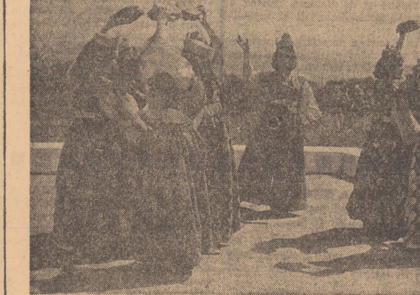
O parte a trupei de dansuri naționale a Tunisiei, pe care o instruește cunoscutul coregraf sibiuan Ion Macrea

VINUL LUI BRAHMS Johannes Brahms (1833—1897) fiind invitat la masa unui vestit podgorean i s-a servit un vin foarte bun, pe care compozitorul nu conțenea să-l laude. — Știi, explică măgălit podgoreanul, acesta este „Brahms“—ul vinurilor mele. — Admirabil — bătu din palme încetănit, autorul Revue-mul german. În acest caz, diseară vreau să beau „Beethoven“—ul faimoaselor dumitale plîvinți!