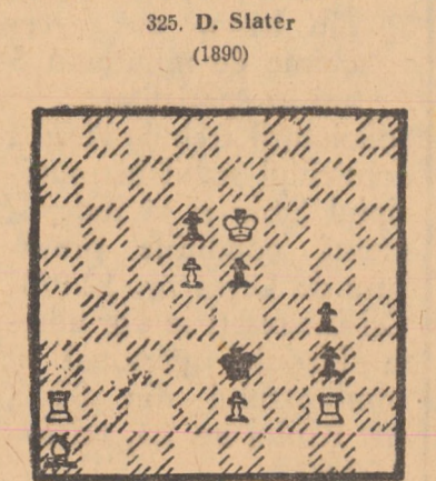
3x (6+5) (va urma) A. F. I.

Începem cu școala engleză. Compozitorii englezi au încetat treptat să compună problema cu soluția mai lungă de 3 mutări, acordând totodată mai multă atenție problemelor cu mat în 2 mutări, care încep să se dezvolte impetuos. Trăsăturile caracteristice pentru creațiile școlii engleze au fost formulate astfel: regele negru să dispună de cimpuri de re-fugiu, să fie liber; jocul din soluție clar și precis, soluția frumoasă cu mai multe variante fine și „corecte“ (adică fără dualuri), maturi curate. Propunem spre dezlegare o problemă caracteristică acestei școli. 325. D. Slater (1890)