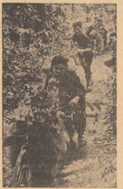
VIETNAMUL DE SUD. În foto: Tineri și tinere din Quang Tri-Thua Thien, transportînd alimente și arme pe front.

str. J. S. Bach nr. 4 RECRUTEAZĂ pentru anul școlar 1972—1973 candidații pentru UCENICIE LA LOCUL DE MUNCĂ, CURS DE ZI, pentru următoarele meserii: — STRUNGAR — FREZOR — SCULER-MATRITER — SUDOR — ELECTRICIAN. Se pot prezenta absolvenți ai școlii generale de 10 ani sau promoții clasei a VIII-a a școlii generale, dacă nu au depășit vârsta de 18 ani. PROBELE DE CONCURS: — matematică — scris și oral — fizică — scris și oral. Înscrierile se fac la I.R.U.M. Sibiu, str. J. S. Bach nr. 4, pînă la data de 5 iulie 1972. Concursul de admitere se va ține între 6—14 iulie 1972.