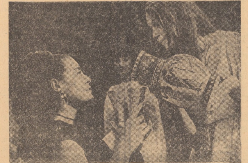
Cădru din filmul bulgar Esp, care rulează la cinematograful „7 Noiembrie” din Dumbrăveni

APOLDA DE SUS: 23 AUGUST; Atunci i-am condamnat pe toți la moarte (orele 18,00 și 20,00).