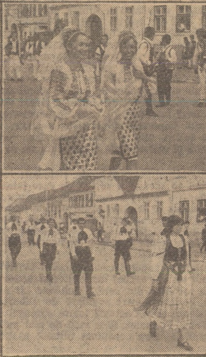
Aspecte de la tradiționalul festival cultural „Cireșar '72” din Cîsnădie