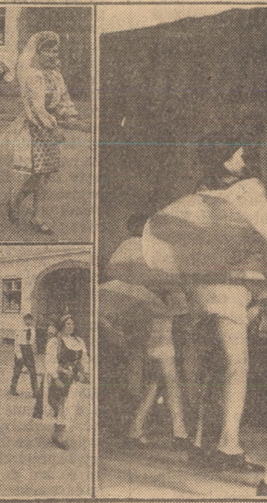
Aspecte de la tradiționalul festival cultural „Cireșar '72” din Cîsnădie