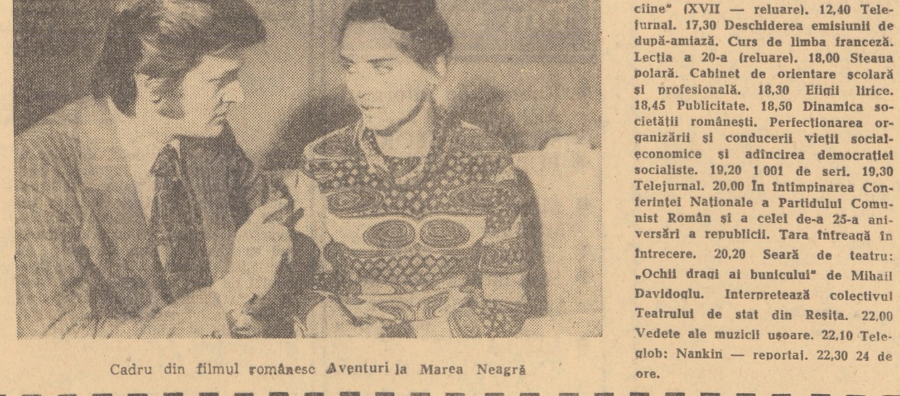
Cadru din filmul românesc „Aventuri la Marea Neagră”

SIBIU: PACEA: Aventuri la Marea Neagră (orele 9,00; 12,30; 16,30; 20,00); ARTA: Aeroportul (orele 9,30; 12,00; 14,30; 17,30; 20,30); TINERETULUI: Omul orchestră (orele 10,00; 12,00; 14,30; 16,30; 18,30; 20,30); INDEPENDENȚA: Dincolo de barieră (orele 11,00; 14,30; 16,30; 18,30; 20,30).