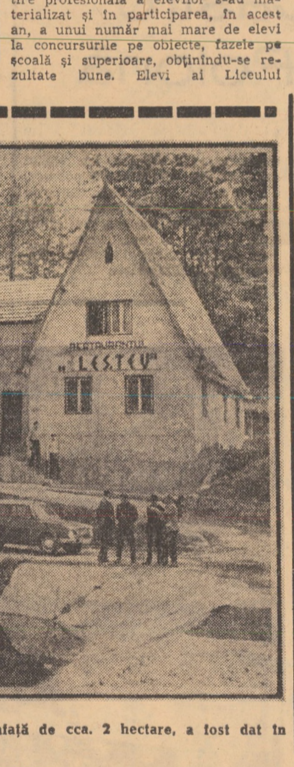
Zilele trecute, pe drumul dintre Mediaș și Moșna, lângă un lac cu o suprafață de cca. 2 hectare, a fost dat în folosință restaurantul „Elesu”.