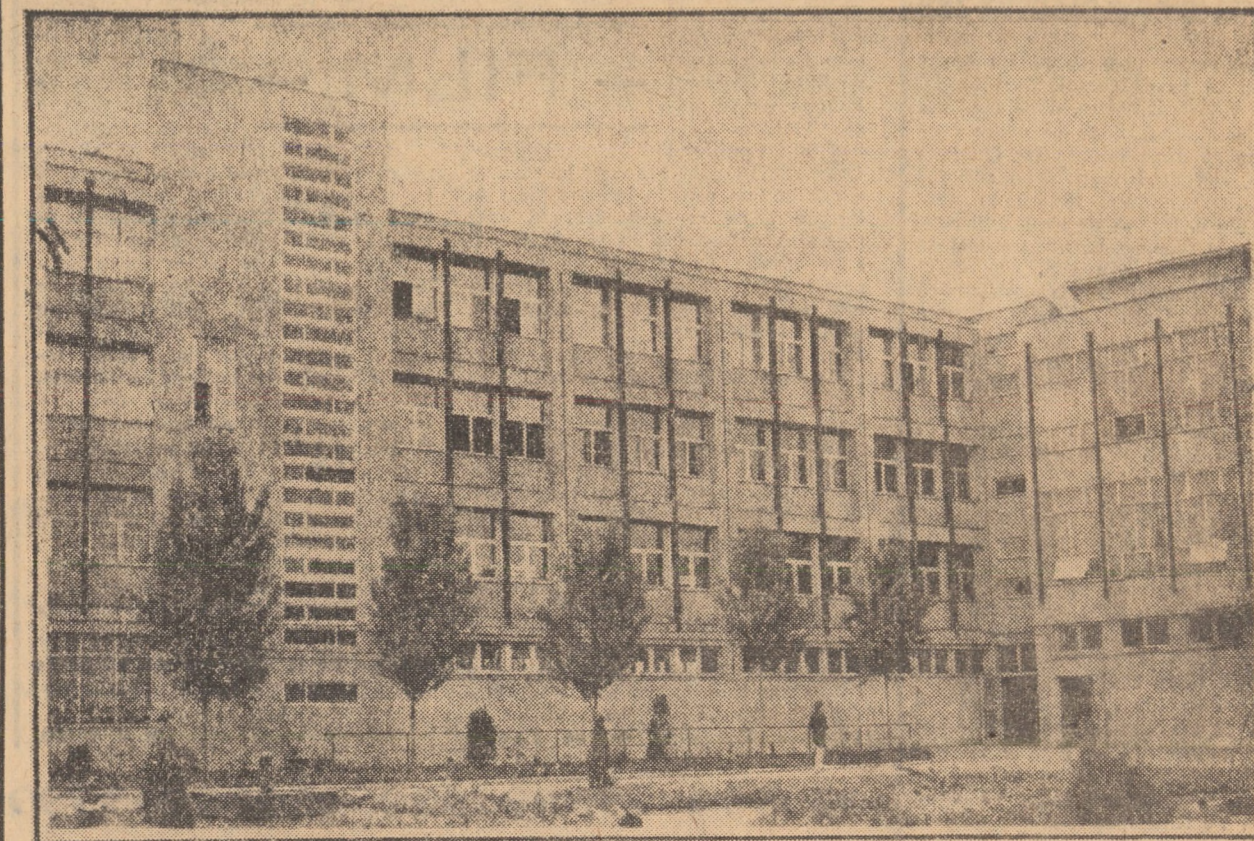
În ultimii ani, prin importante lucrări de investiții, fabricile și uzinele din zona industrială a Sibiului au cunoscut o largă dezvoltare prin construirea a noi hale spațioase. În fotografie: Aspect din incinta fabricii „Libertatea”