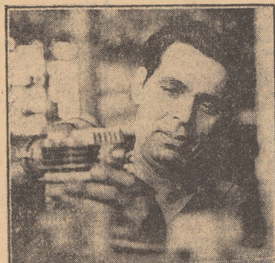
(Continuare în pag. a III-a) L. VIRGIL

Întreprinderea de reparații utilaje și mecanisme Sibiu. O firmă depășită de timp și de faptele oamenilor. Căci de fapt sîntem într-o mare uzină de utilaje și mecanisme destinate în special silviculturii. O uzină unde un colectiv de peste 700 de oameni au făcut improprie o inscripție. O uzină care deserveste întreaga țară și care, pentru utilajele și mecanismele ce le fabrică a făcut și face pionierat în țară, lucru care a