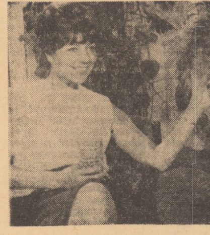
Cadru din filmul Marea dragoste, care rulează la cinematograful „Arta” din Sibiu.

Centrul meteorologic Sibiu comunică: vreme frumoasă și călduroasă cu cerul mai mult senin. Vîntul va sufla slab pînă la potrivit din sectorul nord-estic. Minimele vor fi cuprinse între 9 și 12 grade, iar maximele vor oscila între 21 și 25 grade.