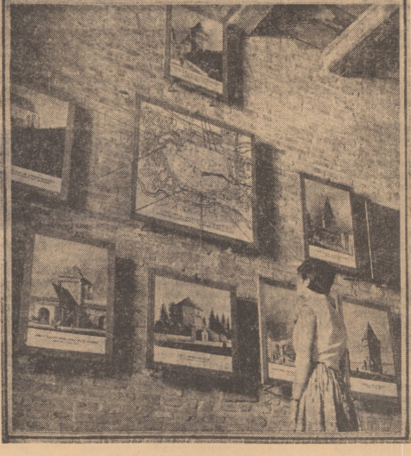
În interiorul Muzeului de istorie din incinta Turnului statului Sibiu. În fotografie: Vechile porți ale urbei