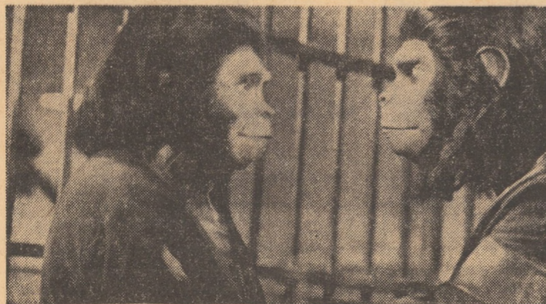
Cadru din filmul Evadare din Planeta Maimuțelor.

6 Iunie Timpul Central meteorologic Sibiu comunică vreme frumoasă și călduroasă cu cerul variabil ziua, senin noaptea și diminețea. Vîntul va sufla slab pînă la potrivit din sectorul estic. Minimele vor fi cuprinse între 8 și 12 grade, iar maximele vor oscila între 22 și 25 grade.