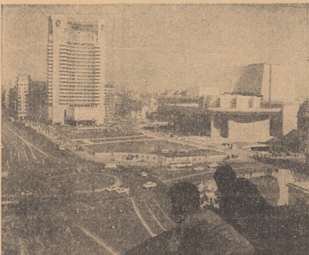
București. Piața Universității, cu hotelul Intercontinental și Teatrul Național (în construcție)

Prin autoutilare la o eficiență economică sporită