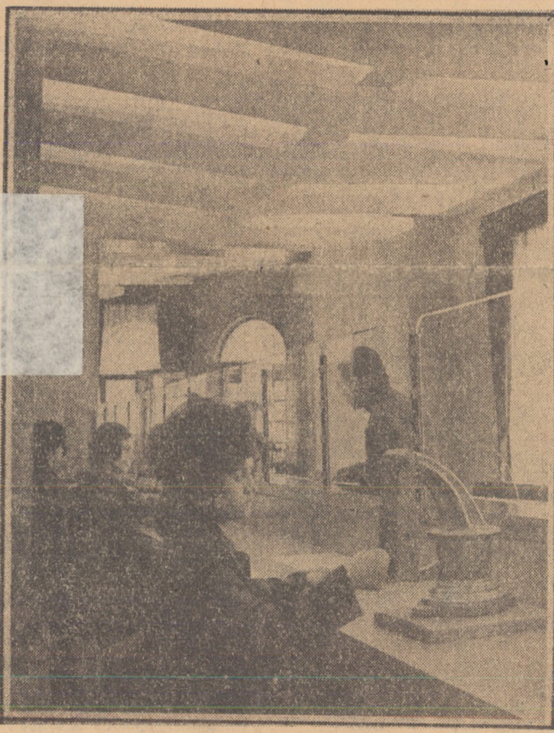
Cadru din noul local al Agenției de voiaj C.T.R. Sibiu, deschis zilele trecute în str. Nicolae Bălcescu

Vineri după-amiază, tovarășul Ion Pătan, vicepreședinte al Consiliului de Miniștri, ministrul comerțului exterior al Republicii Socialiste România, a avut o întîlnire de lucru cu Ibrahim Moneim Mansour, ministrul economiei Sudanului. Au fost discutate probleme legate de perfecțarea unor înțelegeri privind cooperarea economică și tehnică, precum și schimburile de mărfuri pe anul în curs.