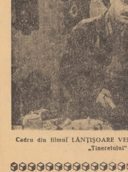
Cadru din filmul LANȚIȘOARE VERZI, care rulează la cinematograful „Tineretului” din Mediaș

Considerăm că organele de conducere din unele unități trebuie să renunțe la asemenea optimism de față, la asigurări formale, deoarece este știut că niciodată nu s-au obținut - și nu se vor putea obține - producții animale de calitate.