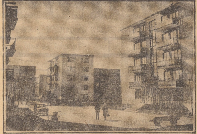
Prin cartierul de locuințe Teresian din Sibiu

O inițiativă demnă de atenție. La Agnita, Consiliul popular al orașului a inițiat un colocoliu cu cei mai vârstnici cetățeni ai orașului.