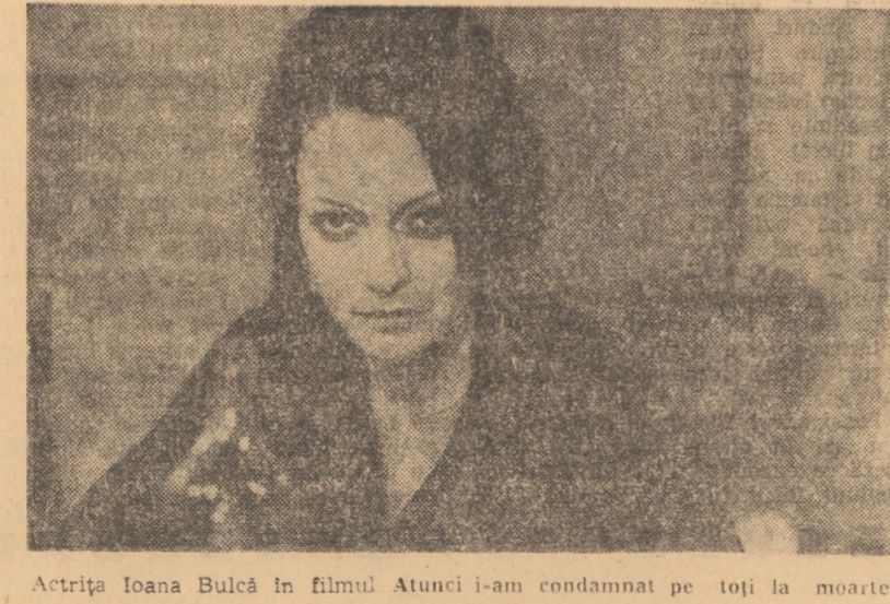
Actrița Irina Bulcă în filmul Atunci i-am condamnat pe toți la moarte.