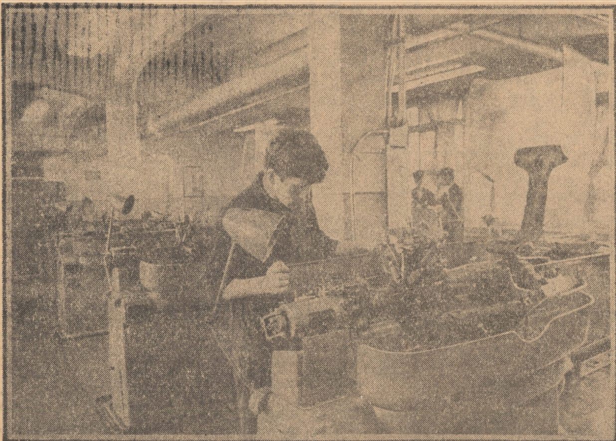
Grupul de mașini automate pentru confecționat armături metalice la diferite produse — Fabrica „Flamura roșie”, Sibiu

mice vor înscrie pe agenda de lucru a conferinței probleme și propuneri menite să înlăture neajunsurile ce s-au manifestat în materializarea sarcinilor de plan. Ziarul nostru pune în continuare coloanale sale la dispoziția tuturor celor care vor să exprime puncte de vedere, sugestii sau propuneri emanate din experiența proprie a specialiștilor, cadrelor de conducere, maistrilor și muncitorilor din toate sectoarele economiei județului nostru.