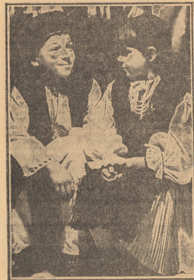
„Azi am să-mi creșter în grinda...“