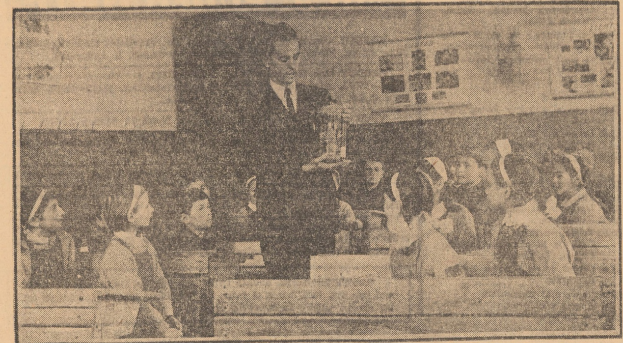
Orele de zoologie la Școala generală din comuna Tilișca se desfășoară în condiții optime. Un bogat material didactic stă la dispoziția elevilor.

Respectîndu-se aceste indicații și desfășurîndu-se o muncă politică de om la om — să se asigure în baza materială completă a formelor de tragere de ofițeri instructori; să se pregătească teoretic și practic fiecare luptător și subunitate în vederea executării deșințelor; să se stabilizească și să se execute din timp ziua în care se va aneunța tragerea pentru a nu se suprapune cu alte activități; să se asigure mijloacele de transport atât pentru instalarea din timp a poligonului cît și pentru deplasarea subunităților în poligon; organele de partid și conducerea întregilor și comunităților să participe efectiv la executarea deșințelor, ajutînd pe ofițerul instructor în menținerea ordinii și disciplinei în timpul de tragere.