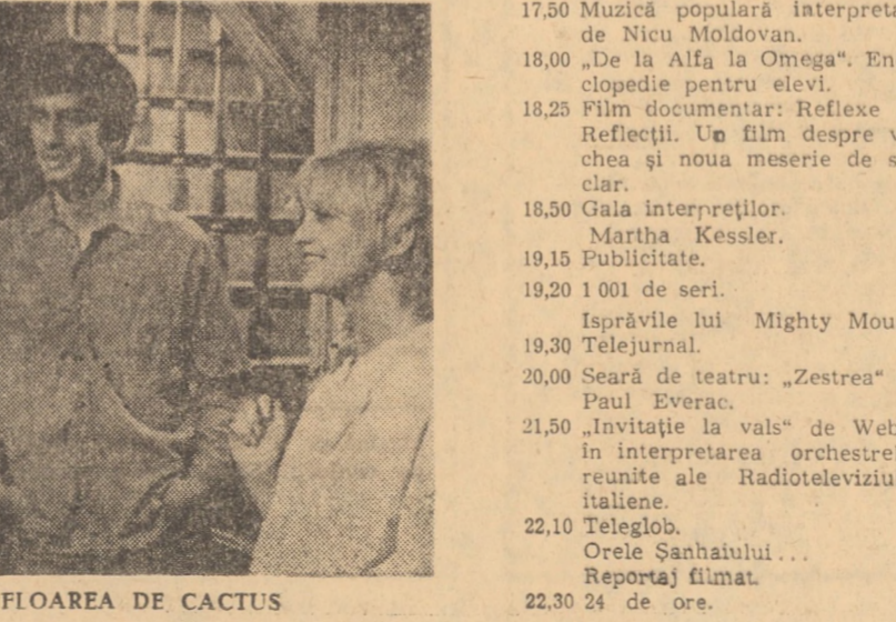
Cadru din filmul FLOAREA DE CACTUS