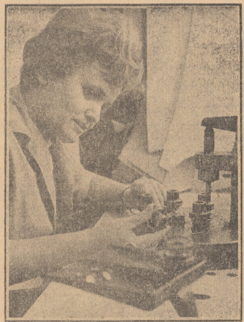
Mașina de îmbrăcat nasturi, utilaj realizat prin autoutilaj la Fabrica de confecții Sibiu, are o productivitate de 4000 bucăți nasturi în 8 ore.