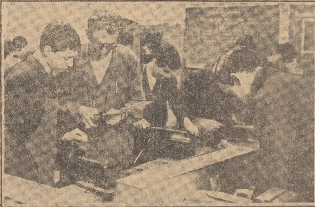
Oră de lucrări practice în atelierul de lăcătușerie al Școlii generale nr. 1 din Sibiu.