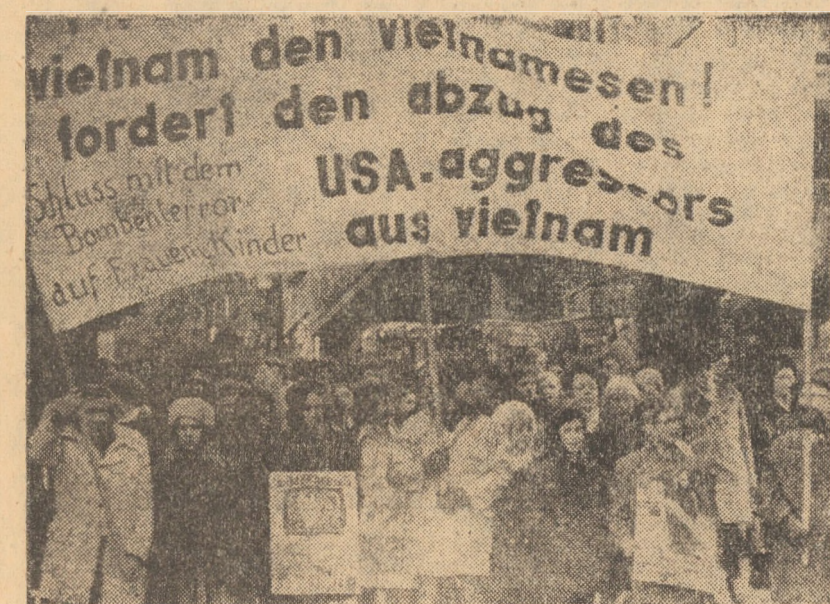
R.F.A. GERMANIEI. Presa din lumea întreagă comentează faptul că aviația americană a reînceput bombardarea teritoriului R.D. Vietnam, în regiuni dens populate, provocînd victime în rândurile populației civile, distrugînd școli, spitale și locuințe. În diferite țări din lume au avut loc demonstrații împotriva acestor bombardamente. Opinia publică cere cu insistență terminarea războiului din Indochina, retragerea întregului efectiv militar american în timp cit mai scurt, spre a se evita noi victime omenești și pagube materiale. În foto: demonstrație la Essen împotriva bombardamentelor din R.D. Vietnam