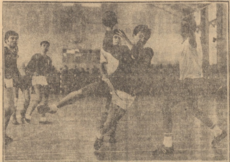
Cupa de iarnă — Handbal: A.S.A. Sibiu—Metalul Copșa Mică