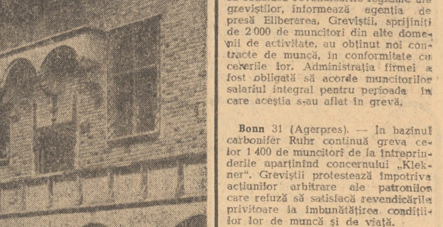
R.P. POLONĂ. În foto: curtea interioară cu frumoasele și vechile sale arcade în stil gotic, a cădării Colegiului „Maius”, odinioară faimoasa universitate cracoviană „Jagellon” fondată în anul 1364

SAIGON 31 (Agerpres). — În urmă grevei de cinci zile declarată de muncitorii din Saigon angajați de firma americană de transporturi „U.S.A.T.D.”, administrația acestora a fost obligată să satisfacă revendicările legitime ale greviștilor, informează agenția de presă Elberrorea. Greviștii, în număr de 2000 de muncitori din alte domenii de activitate, au obținut noi contracte de muncă, în conformitate cu cererile lor. Administrația firmei a fost obligată să acorde muncitorilor salariul integral pentru perioada în care aceștia s-au aflat în grevă.