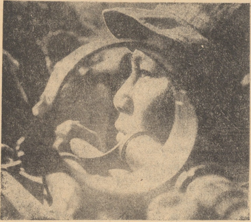
VIETNAMUL DE SUD. În foto: Tran Xuan Tinh, membru în compania a 8-a a Armatei Naționale de Eliberare din Vietnamul de Sud, este deținătorul Ordinului „Erou al Eliberării”. În timpul unei operații militare din martie 1971, Tran Xuan Tinh a fost rănit dar a continuat să lupte încă, în 5 bătălii, omorând astfel 27 de dușmani