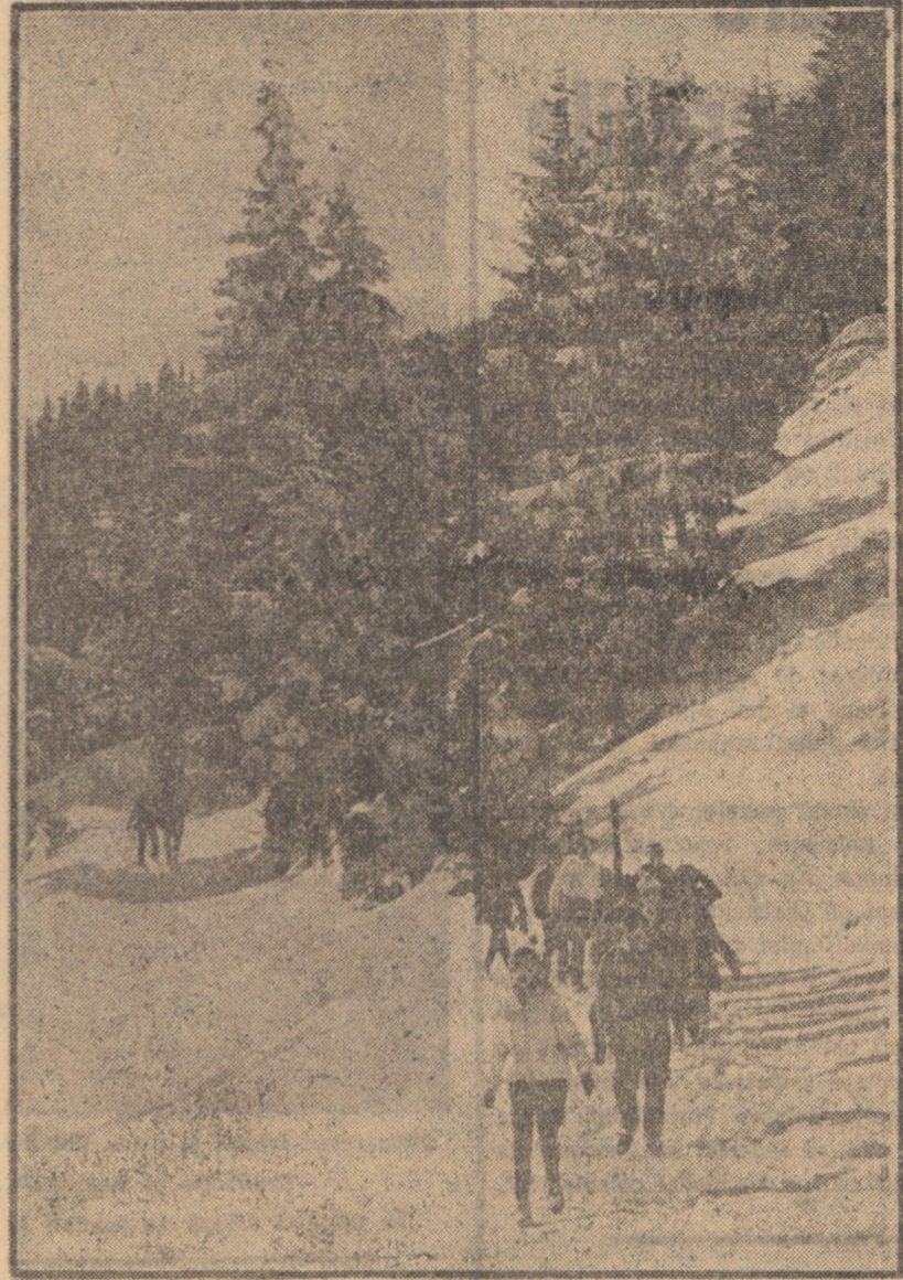
O excursie în munți, în această țară când zăpada se lasă așteptată, te transpune deodată în peisajul alb, al sporturilor alpine...