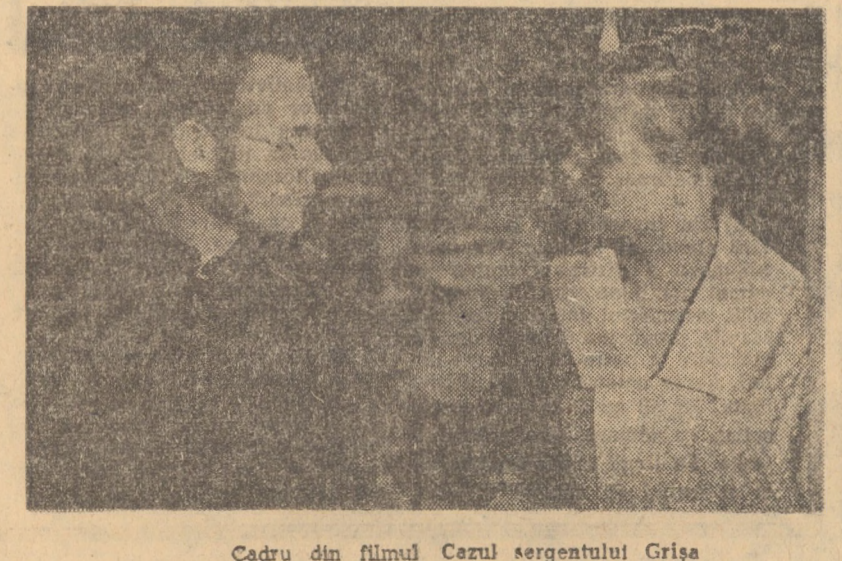
Cadru din filmul Cezul sergentului Grișa

SIBIU: PACEA: Anna celor o mie de zile, seriile I și II (orele 14.00; 17.00; 20.00); ARTA: Direcția Berlin (orele 10.00; 12.00; 14.30; 16.30; 18.30; 20.30); TINERETULUI: Răzbu-narea hauducilor (orele 10.00; 12.00; 14.30; 16.30; 18.30; 20.30); INDEPENDENȚA: Serata (orele 14.30; 16.30; 18.30; 20.30). MEDIAS: PROGRESUL: Tick... tick... tick... (orele 9.00; 11.15; 14.00; 16.30; 19.00; 21.15); TINERETULUI: Boxerul (orele 10.00; 16.30).