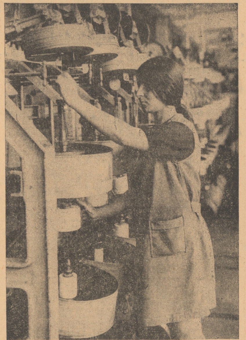
R.P. BULGARIA. Automatizarea a început să fie cuvîntul cel mai des folosit în discuțiile privind dezvoltarea industrială, căci munca computerelor și a aparatelor de calcul ajută gîndirea și munca omului, face să crească calitatea și cantitatea producției împulsionînd în același timp organizarea muncii. Fabrica de cabluri Vasil Kolarov din Burgas a fost dotată cu un centru de computere și conveiere moderne. În foto: o muncitoare de la Uzina de cabluri „Vasil Kolarov” din Burgas controlînd operațiile unei mașini pentru acoperirea caburilor

Șeful delegației vest-germane la convorbiri, ministrul de externe W. Scheel, a părăsit sîmbătă dimineața Varșovia, plecînd la Bonn. El va reveni în capitala poloneză la 18 noiembrie, dată la care tratatul polono-vest-german urmează să fi parafat.