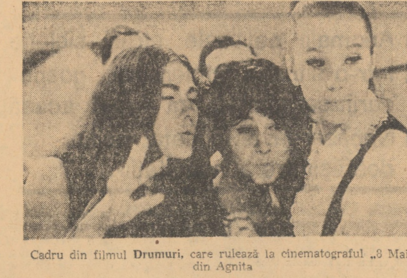
Cădru din filmul Drumuri, care rulează la cinematograful „3 Mai” din Agnita

8,45 Deschiderea emisiunii. Gimnastica de dimineață. 9,00 Matineu duminical pentru copii și școlari. 10,00 Viața satului. 11,30 Amfiteatru muzical. Beethoven azi. 12,00 De străji patriei. 12,30 Fotbal: Petrolul — Dinamo București. Transmisune directă de la Ploiești. 14,30 În reluare, la cererea telespectatorilor. Lume, lume — film omagial închinat Mariei Tănase. 15,00 Emisiune în limba maghiară. 16,30 Studioul „N”. 18,00 Unde-i greșeala? — emisiune-concurs. 19,00 Cîntec și joc din Tara de Sus. Spectacol dat de ansamblul „Ciprian Porumbescu” al Casei de cultură a sindicatelor și de artiști amatori din Bilca, Rădăseni și Iaslovăț — județul Suceava. 19,30 Telegazeta de seară. 20,00 Film artistic. O proprietăreasă ciudată. Premieră pe tară. 21,55 Sapte note în cheia sol. Emisiune muzical-coregrafică. 22,35 Telegazeta de noapte. 22,45 Duminică sportivă. 23,00 Închiderea emisiunii.