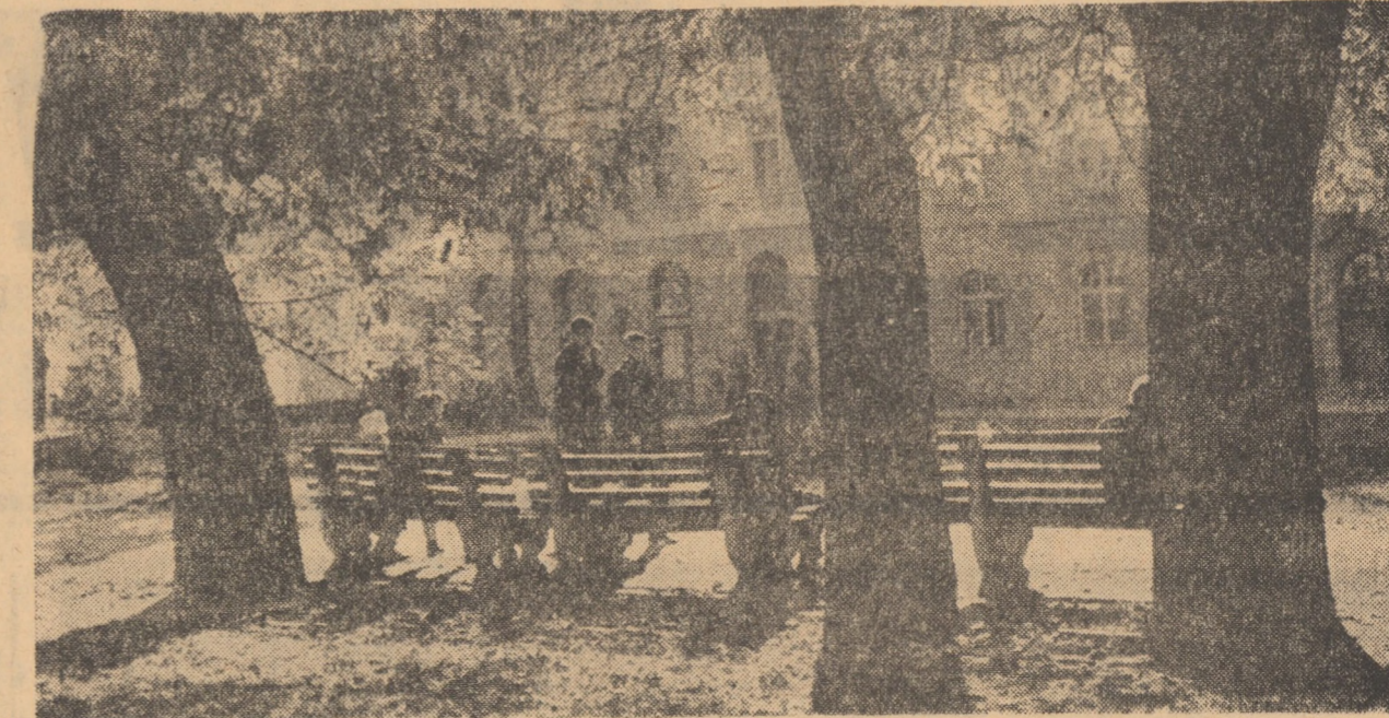
Zile de toamnă trize