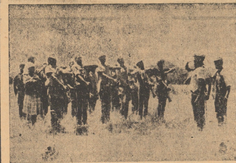
ANGOLA. În foto: O unitate a forțelor armate de eliberare din Angola, în timpul unui antrenament pentru pregătirea de luptă împotriva colonialiștilor portughezi

• NINSORILE ȘI POLEIUL care au acoperit o serie de șosele din Scoția și regiunile nordice ale Angliei au oferit insularilor de dincolo de Canalul Mincii primele neacuzări ale iernii din acest an. Una dintre șoselele principale care, trecînd peste Munții Pennini, leagă importante localități Manchester și Leeds, a fost vreme de câteva ore blocată de zăpadă, în timp ce pe alte drumuri s-au produs o serie de accidente de circulație. Ninsorile au fost însoțite de o sensibilă scădere a temperaturii