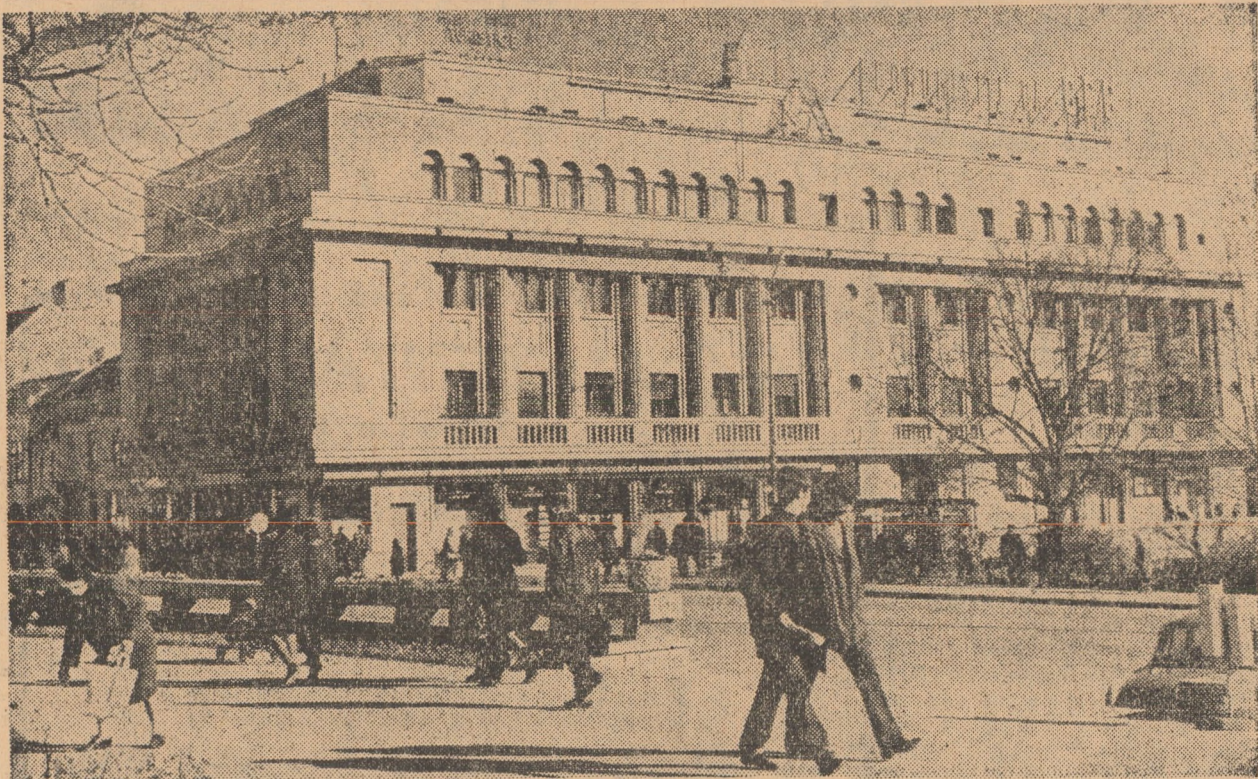
Din peisajul cotidian al Sibiului