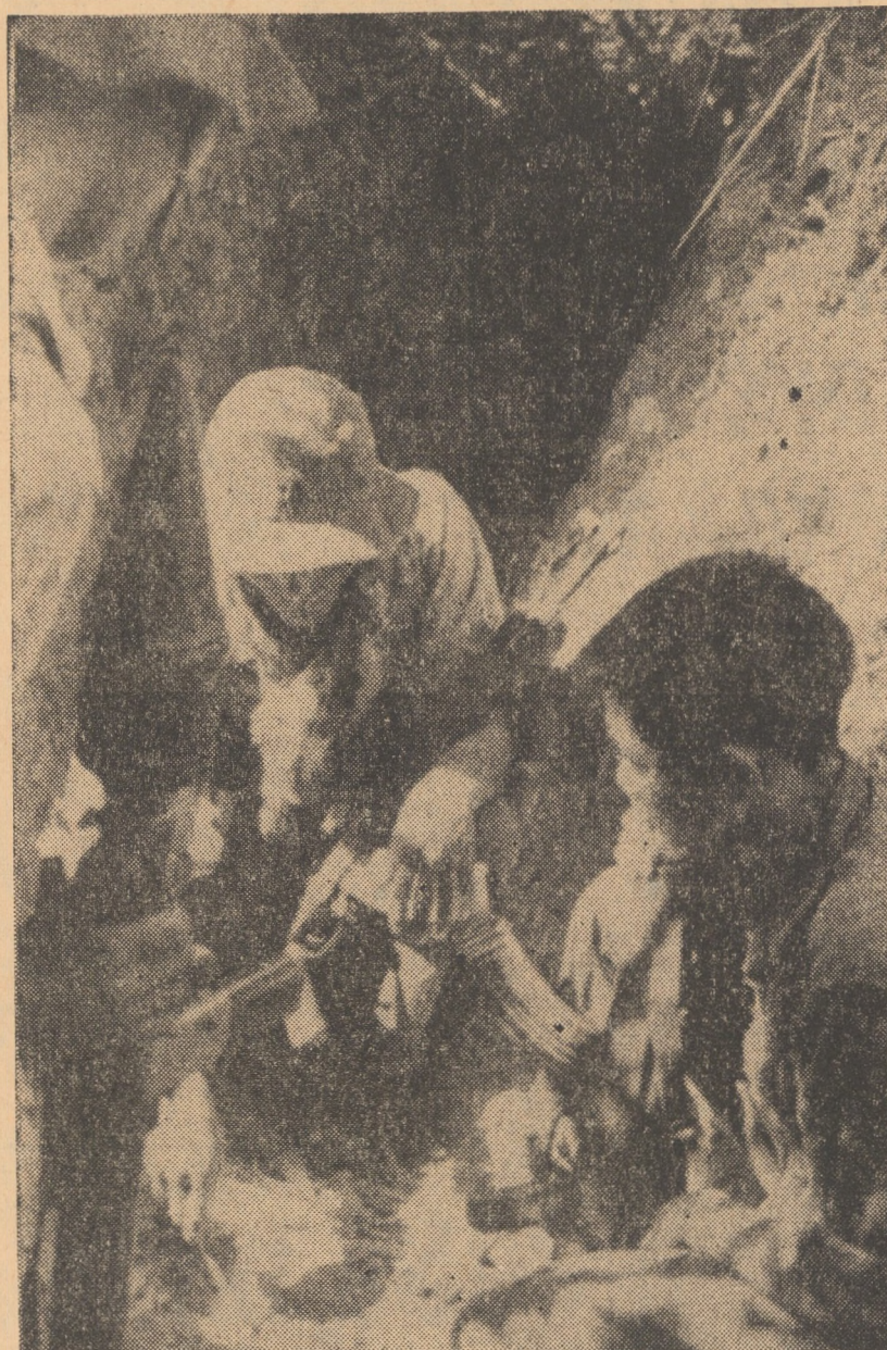
VIETNAMUL DE SUD. În foto: unitate militară a F.N.L., pregătindu-se pentru un atac în regiunea Quang Tri

În încheiere, Gheorghe Diaconescu a arătat că delegația română se pronunță pentru invalidarea scrisorilor de acreditare ale ciancașitelor, care ocupă în mod ilegal și abuziv locul legitim al R.P. Chineze la Națiunile Unite. De asemenea, a subliniat el, nici scrisorile de acreditare ale celor care ocupă locul Cambodgiei la O.N.U. nu pot fi recunoscute ca valabile, întrucât nu emană de la guvernul legitim al acestei țări, guvernul regelui de unitate națională.