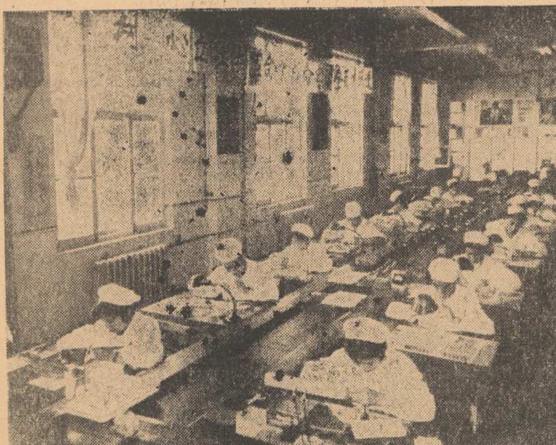
R.P. CHINEZĂ. Kweilin este un oraș de munte, situat în regiunea autonomă Kwangsi Chuang, oraș turistic care a devenit acum și un însemnat centru industrial. În foto: aspect din fabrica de instrumente electrice, sala de asamblare, din Kweilin

În timpul întîlnirilor, premierul egiptean a precizat că planul de constituire în viitor a unei uniuni a celor trei țări nu înseamnă constituirea unui bloc contra celorlalte țări arabe, ci dimpotrivă este dorit deschiderea unui dialog între cele trei țări și statele arabe care se opun proiectului.