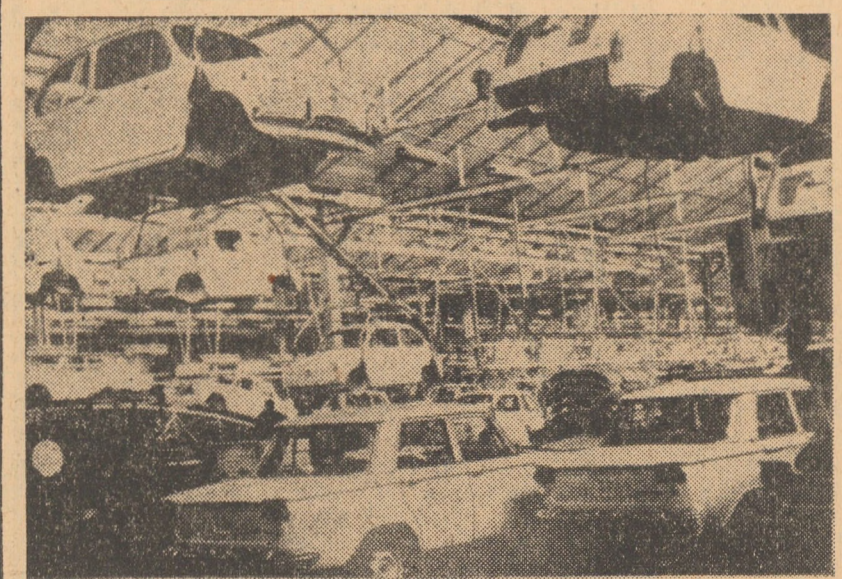
FUGOSLAVIA. Fabrica de automobile „Grvena Zavasta” din Kragujevac, Serbia, care produce automobile în cooperare cu Fabrica Fiat din Torino.