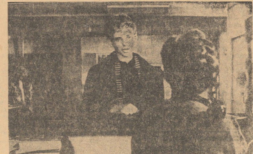
Cadru din filmul Discuție bărbătească