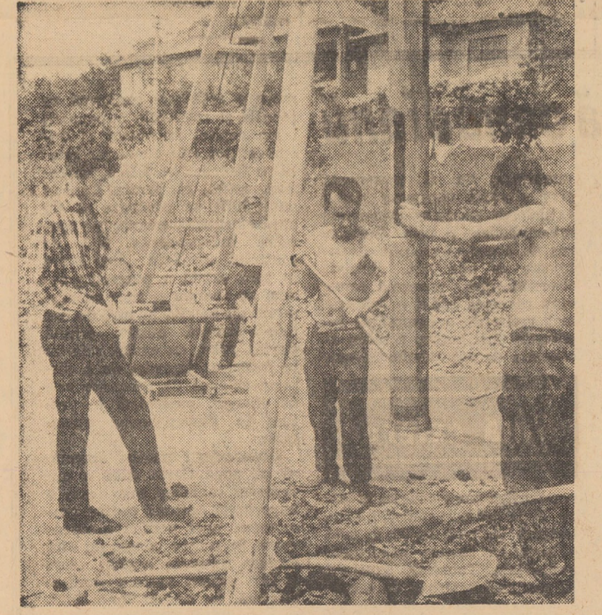
În locurile unde urmează a fi ridicate noi construcții de locuințe, în municipiul Mediaș se fac prospecțiuni ale terenului în vederea stabilirii constituției geologice și a adâncimii fundațiilor, lucrări executate de D.S.A.P.C. Brașov

— Vă rugăm să ne relați în ce măsură instituirea treptelor și građațiilor a creat întreprinderii posibilitatea aprecierii mai nuanțate a muncii salariaților. — Perioada care a trecut de la începerea experimentării elementelor noului sistem de salarizare, deși scurtă, a demonstrat viabilitatea acestui sistem, a confirmat eficiența diferențierii pe trepte, în cadrul aceleiași categorii de salarizare la muncitori și pe građații, în cadrul unei clase de salarizare la personalul tehnic-administrativ. S-au creat în acest mod posibilități similare sporite pentru ca fiecare salariat să fie remunerat potrivit aptitudinilor, experienței și conștiințiozității în realizarea sarcinilor, ca și a contribuției personale la îmbunătățirea activității. În afara acestor diferențieri de la individ la individ, al doilea aspect cu-