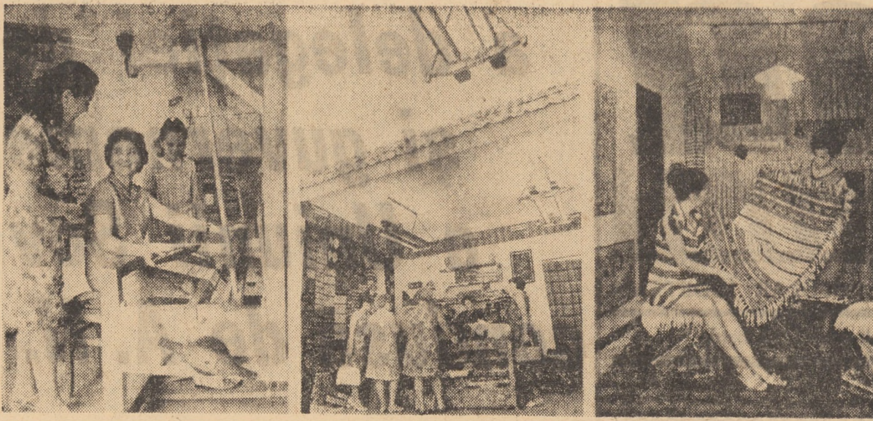
Trei imagini surprinse la expoziția cu vizare „Arta Sibului”, deschisă zilele trecute în Piața 6 Martie, nr. 8 din Sibiu