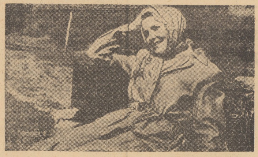
Protagonista filmului Tandrețe, care rulează la cinematograful „8 Mai” din Agnita