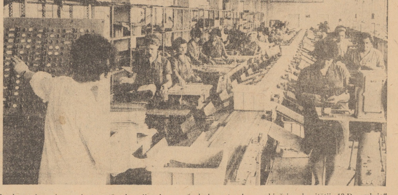
Banda cu deservire semi-automată a locurilor de muncă de la sectorul marochinării al unității „13 Decembrie” din cadrul Combinatului de pielărie și încălțămînte Sibiu, unde zilnic se realizează peste 1.300 bucati serviete

Muncitorii secției de întreținere T.C. de pe lângă Oficiul de poștă și telecomunicații lucrează intens pentru restabilirea normală a