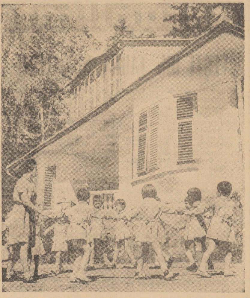
Instantaneu la tabăra din Csnădoara