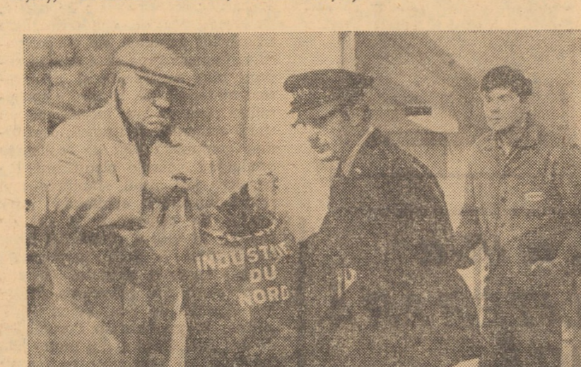
Filmul Soarele vagabonzilor, cu celebrul actor Jean Gabin

junglei (orele 10,00; 16,00; 18,00 și 20,00). CISNĂDIE: POPULAR: Soarele vagabonzilor (orele 11,00; 14,00; 16,00; 18,00 și 20,00). AGNITA: 8 MAI: La dulce via, seriile I și II (orele 10,00; 16,00 și 19,30).