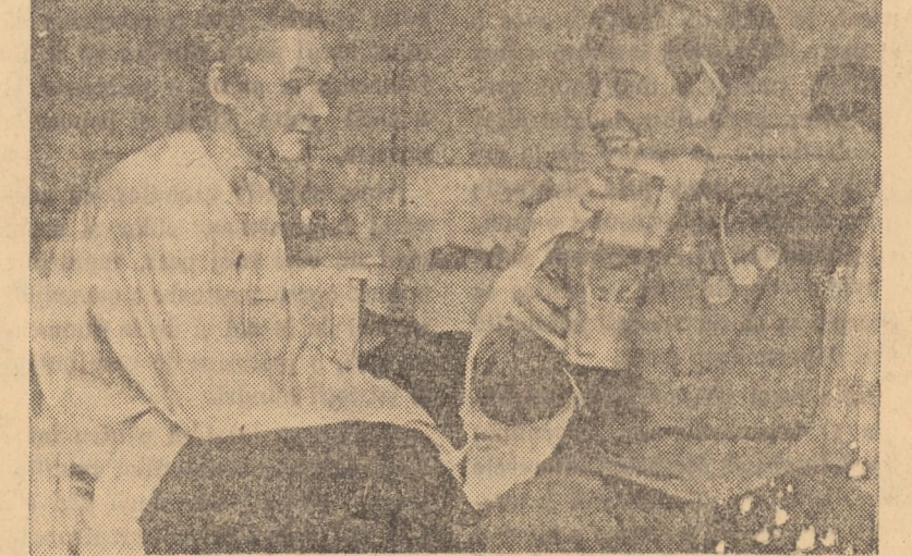
Cadru din filmul BUN PENTRU SERVICIUL AUXILIAR care rulează la cinematograful „Independența” din Sibiu.

FOTBAL — Sibiu: stadion Metalul, ora 8,30, Independența Sibiu