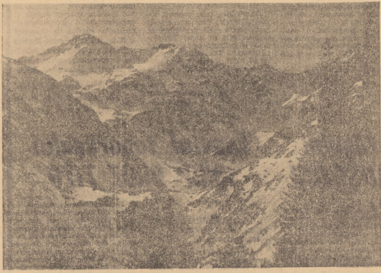
Vedere spre virful Negoi