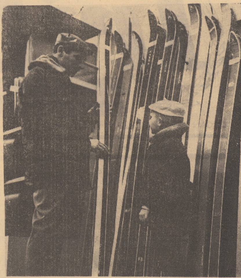
Pregătiri în așteptarea celei de-a doua zăpezi...

După cum ne informează Casa de Economii și Consumațiuni, începînd cu luna ianuarie a.c. se majorează numărul și valoarea cîștigurilor pe care le acordă tragerile la sorți lunare ale obligațiunilor C.E.C.