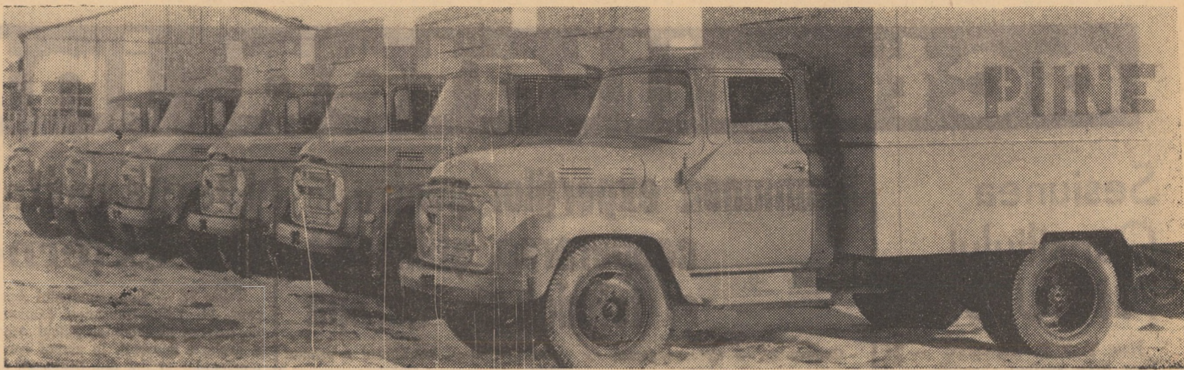
Autodube pentru pine produse de uzina „Automecanica“ din Medias