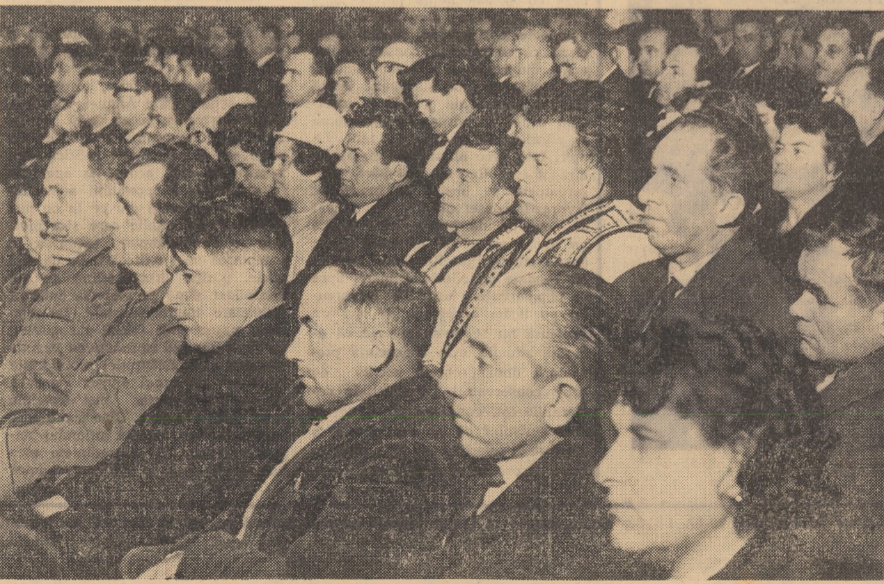
Aspect din sală

În încheierea lucrărilor conferinței, într-o atmosferă de puternic entuziasm, participanții au hotărît să trimită o scrisoare Comitetului Central al partidului, tovarășului Nicolae Ceaușescu, secretar general al C.C. al P.C.R.