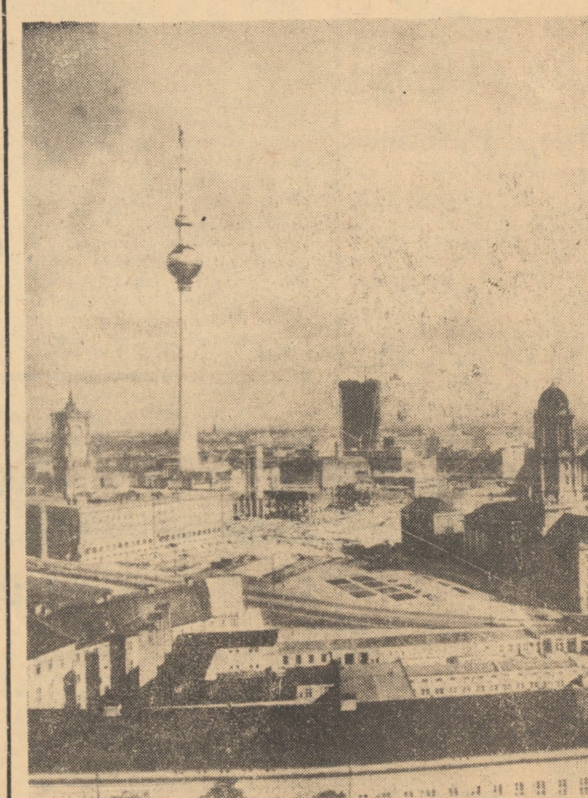
R.D. GERMANIA. Șantierul noilor construcții din centrul capitalei — Berlin — unde vechile clădiri ale Primăriei și Consiliului de Miniștri vor fi flancate de îndrăznețe construcții moderne

Incertitudinea care a caracterizat ultima perioadă a campaniei electorale americane nu a dispărut nici în ziua scrutinului, lupta electorală dintre candidatul Partidului republican, Richard Nixon și candidatul Partidului democrat, Hubert Humphrey, fiind deosebit de strînsă. Nu este întîmplător, deci că alegătorii celui mai mare oraș american, New York, au înflinț în fața birourilor de vot un număr neobișnuit de mare de agenți electorali care, într-un efort de ultim moment, au încercat să-i convingă să voteze în favoarea unuia sau altuia dintre candidați.