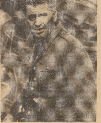
Protagonistul filmului Culoarele luptei, care rulează la cinematograful „7 Noiembrie” din Dumbrăveni.