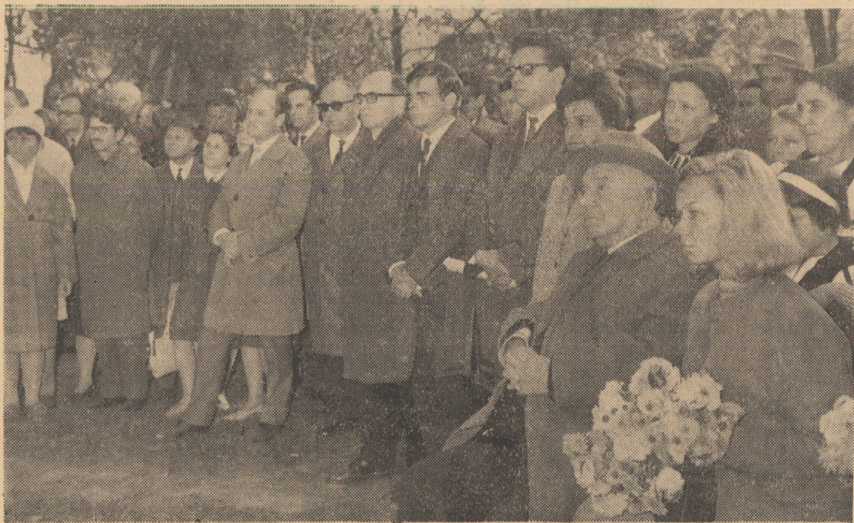
Pios omagiu bardului de la Răsări