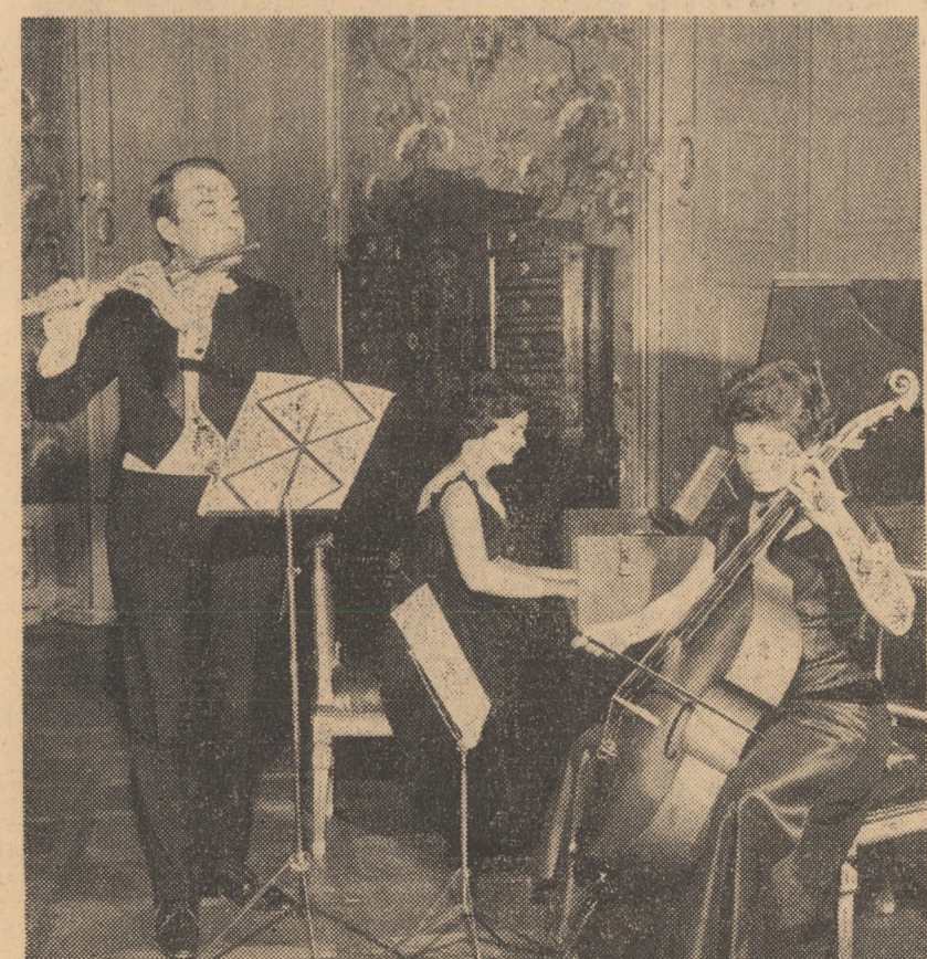
Pasiune și virtuozitate

În interpretarea acestor lucrări aparținînd unui domeniu plin de comori artistice, întotdeauna pasionant, acest ansamblu de cameră a creat o minunată muzică de echilibru în care fiecare este subliniat discret dar constant și profund, a creat o admirabilă muzică sobră a trăirilor din care nu lipsește însă aspectele descriptiv.