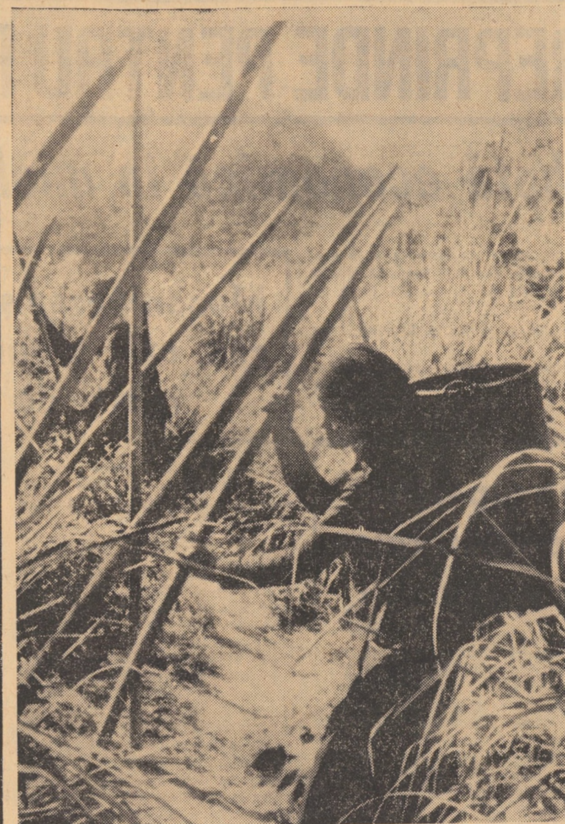
În regiunea Quang Tri, forțe patriotice sud-vietnameze instalează sule împotriva parașuștilor

Lupta electorală se anunță strînsă, iar social-democrații contează pe un avans de 1 sau 2 la sută pentru a-și consolida poziția parlamentară. În această perspectivă se acordă o atenție deosebită tinerilor, al căror vot urmează să întregescă acum pentru prima oară corpul electoral, considerat de regulă ca „stabil”. Accentul pus de social-democrați în campania electorală pe extinderea construcției de locuințe și pe „relansarea” economică pe cale de realizare, în cadrul căreia numărul locurilor de muncă va sporii pentru a absorbi mereu noi cadre, are drept țintă atragerea voturilor tineretului. Rămîne de văzut dacă aceste promisiuni vor fi suficiente, țînînd seamă