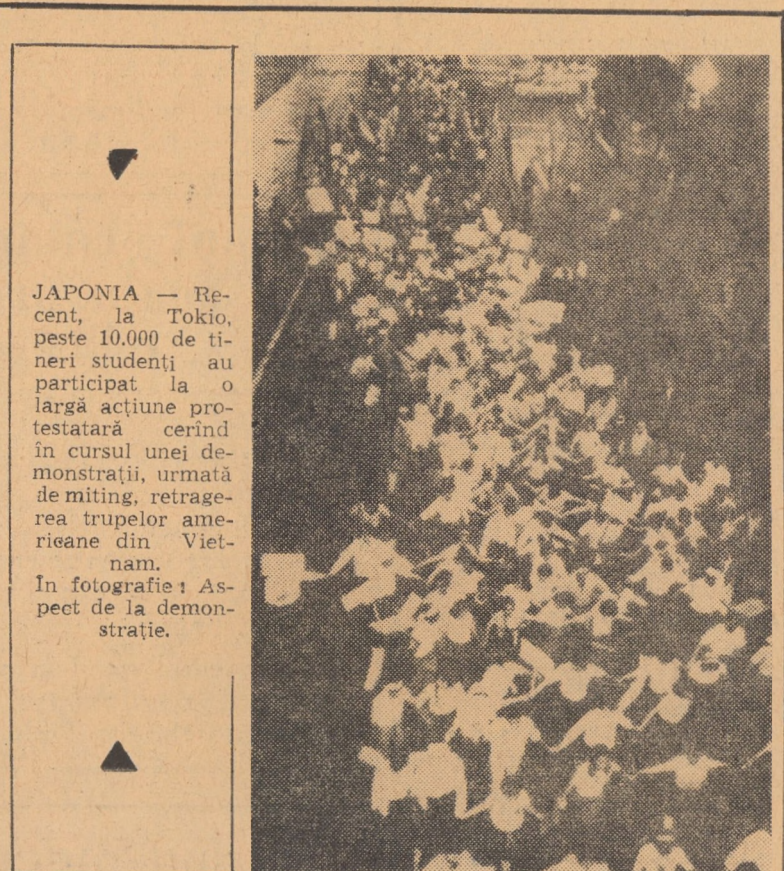
JAPONIA — Recent, peste 10.000 de tineri studenți au participat la o largă acțiune protestatară cerind în cursul unei demonstrații, urmata de miting, retragerea trupelor americane din Vietnam.

s-a desfășurat conferința. El a arătat că, prin importanța lor, recomandările adoptate constituie o etapă importantă în programul U.N.E.S.C.O. destinat colaborării europene.