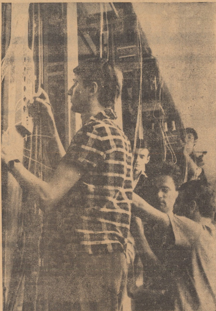
Printre realizările de seamă ale municipiului Sibiu, se va număra în curînd și Centrala interurbană automată, în prezent în fază de montaj. În fotografia de față am surprins pe cîțiva dintre tehnicienii în momentul conectării boxelor de semnalizare cap rînd și curenți speciali