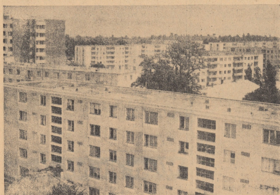
Orașul Sibiu într-o haină nouă