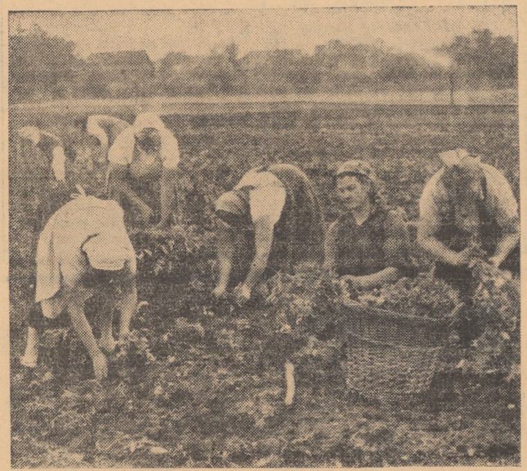
În grădina de legume a C.A.P. Șelimbăr, pe o suprafață de 3 hectare, au fost plantate roși

de combatere a gîndacului din Colorado. Am întrebat-o dacă la Hoghlig s-a întreprins ceva pentru lărgirea suprafeței arabile. „Am destelenit pășunea de la „Canton”, în suprafață de 8 hectare și acum acolo crește porumbul pentru siloz. La brigăzile din Valchid și Prod, o suprafață de 4 hectare teren neproductiv a fost desfundată, lucrată după toate regulile și plantată cu viță de vie din soiuri ameliorate”.