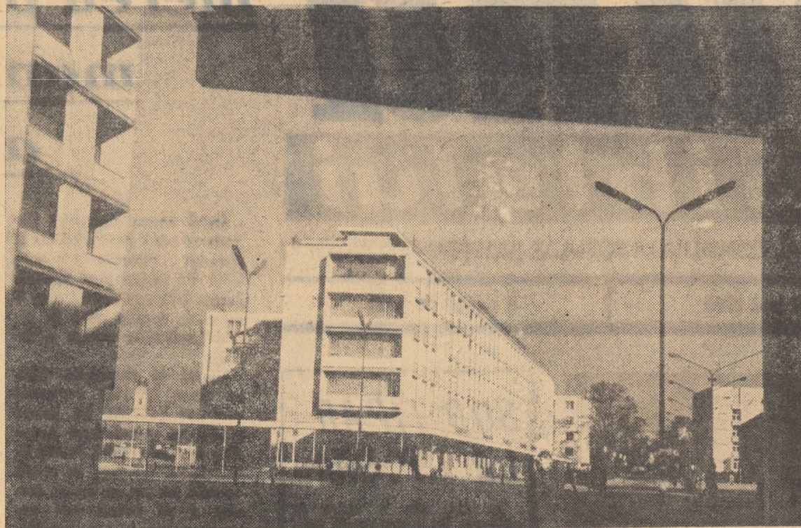
Din noul peisaj al orașului Baia Mare