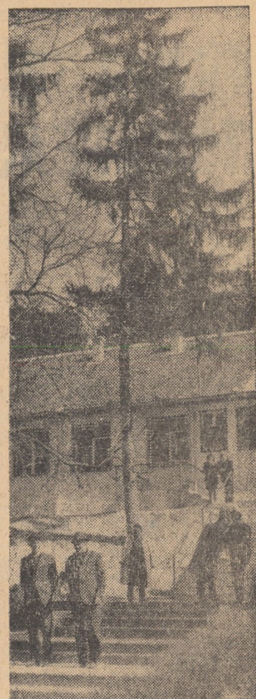
Vedere din stațiunea balneo-climaterică Bazna

Intrucît capacitatea de udare a întreprinderii comunale nu este suficientă pentru cuprinderea tuturor zonelor verzi periferice, comitetul executiv al Consiliului popular al municipiului Sibiu, prin serviciul de gospodărire, face un călduros apel la toți cetățenii orașului de a uda, cu mijloacele ce le stau la îndemînă, arborii și florile din fața locuințelor și zonele verzi din circumscripții, în mod regulat, și cu apă suficientă pentru a nu se ajunge la compromiterea acestora.