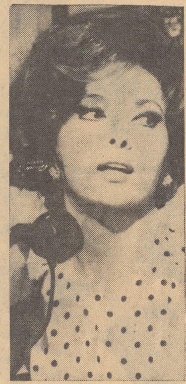
Celebra actriță Gina Lollobrigida, în filmul Eu, eu, eu și ceilalți, care rulează la cinematograful „Victoria” din Sibiu

BAZNA-BĂI: Prostănacul (orele 17,00 și 19,00). COPȘA MICĂ: POPULAR: Unde este al treilea rege (orele 17,00; 19,00). DUMBRĂVENI: 7 NOIEMBRIE: Profesorul distrat (orele 16,00; 18,00 și 20,00). CISNĂDIE: POPULAR: Impușcături pe portativ (orele 11,00; 14,00; 16,00; 18,00 și 20,00).