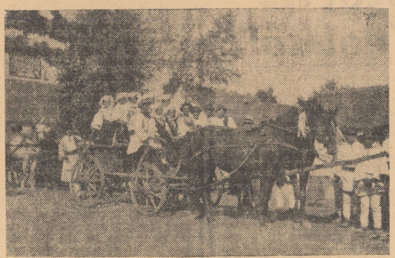
Un conduct, la una din serbările „Astrei”