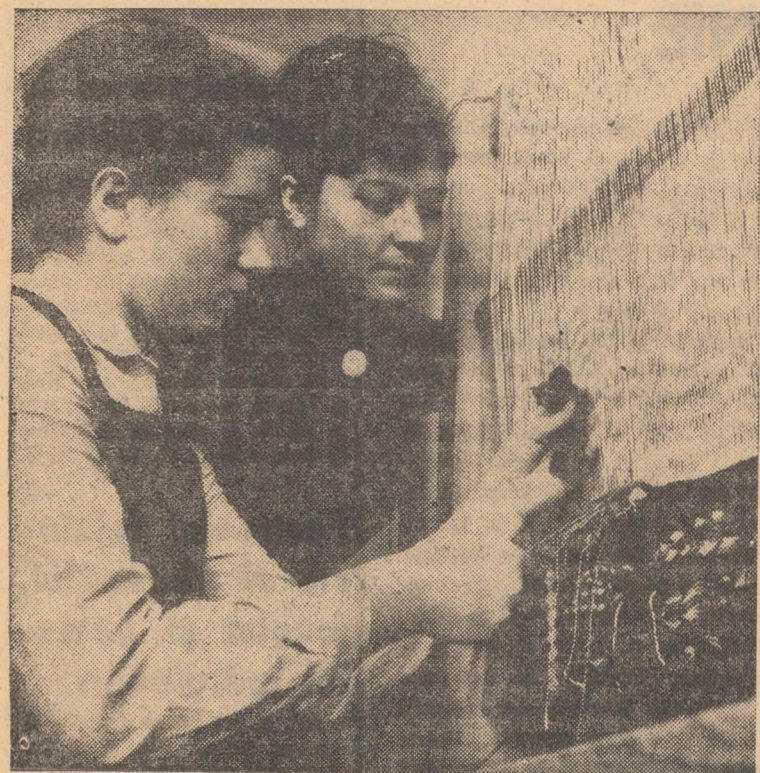
Tinere creatoare de frumoase scoarțe oltenesti la Școala populară de artă din Sibiu.

lor — ne spunea tovarășul inginer șef. Or, fiind absolviți de unele treburi „amărute”, administrative, vor avea posibilitatea găsiți unor soluții de îmbunătățire a organizării științifice a producției, oarecum neglijată, vor putea să conceapă, să experimenteze — cerințe de prim ordin la fabrica respectivă!