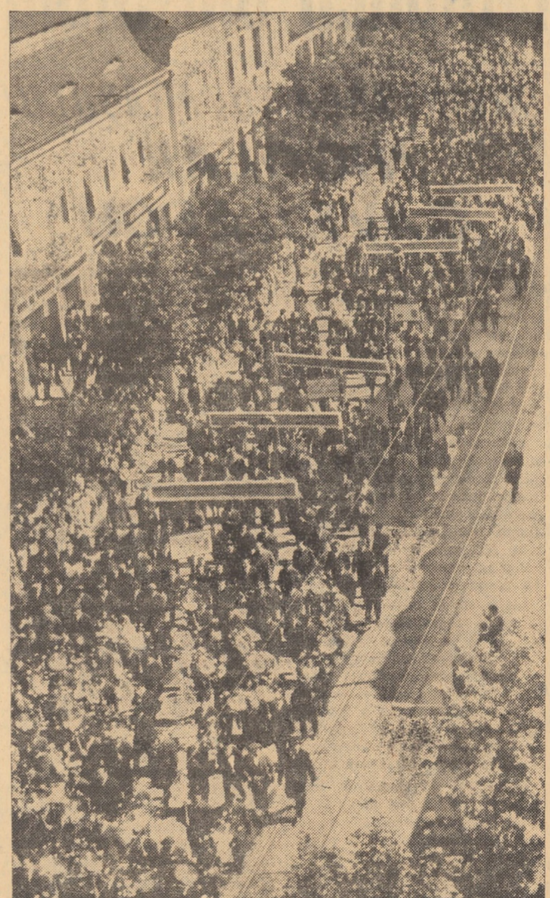
Trec rînduri, rînduri muncitorii...