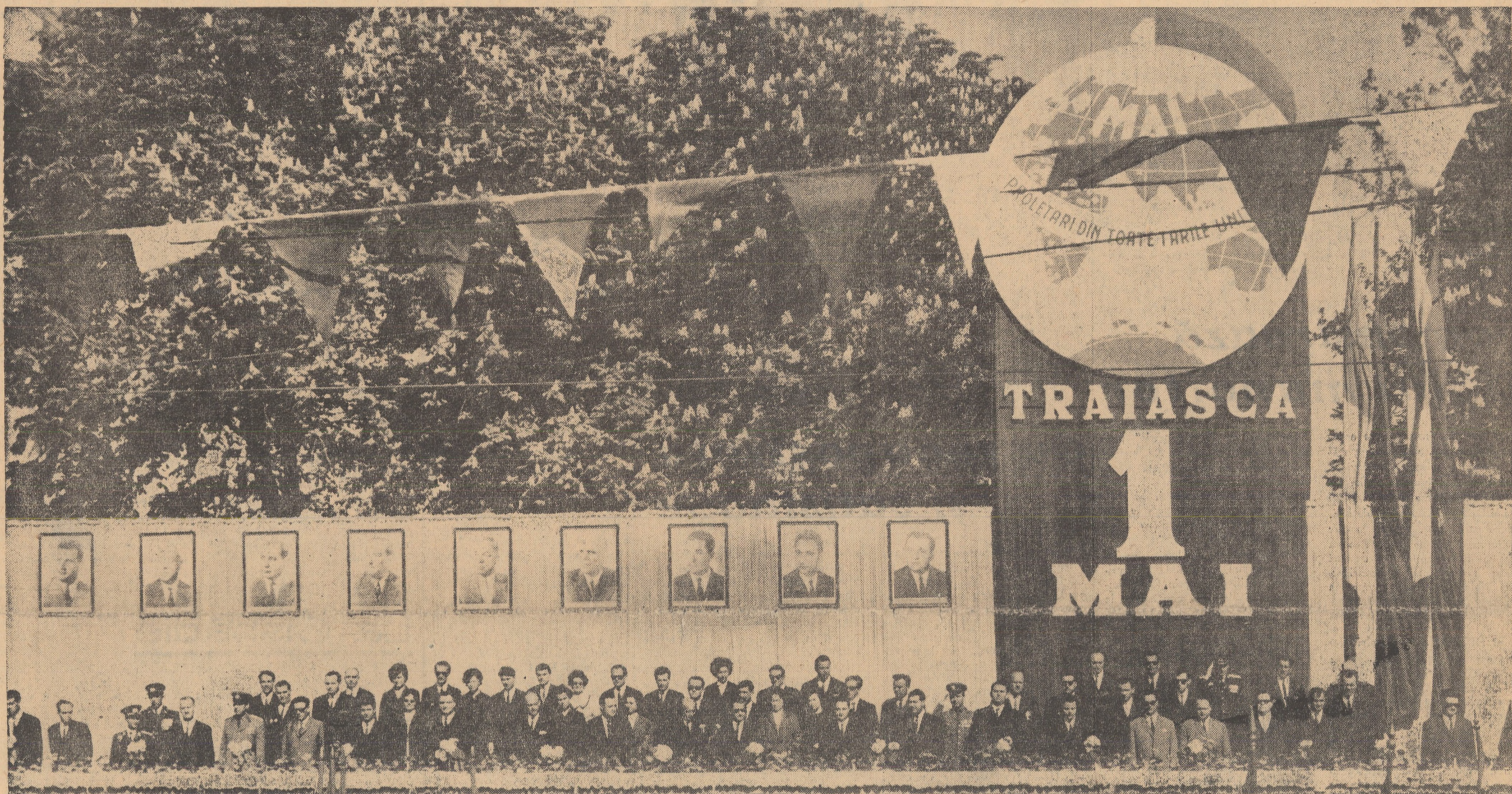
Tribuna oficială în timpul demonstrației oamenilor muncii din Sibiu