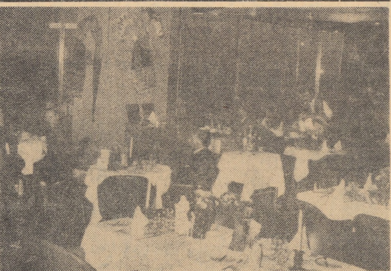
In cadrul „Săptămînii gastronomice internaționale și dineurilor din Orly”, pe aeroportul din această suburbie a Parisului a avut loc inaugurarea „Săptămînii românești”, organizate cu concursul O.N.T. „Carpați” și „La boutique des Nations” de la Orly. In fotografie: Aspect de la „Săptămînile românești”.

versalității, nici o țară nu trebuie să fie lipsită de posibilitatea de a participa la discutarea importantelor aspecte privind promovarea și respectul drepturilor fundamentale ale omului pe plan internațional. Referindu-se la corelația dintre drepturile omului și pacea în lume, Avram Bunaciu s-a oprit asupra condițiilor primordiale — respectul politic, afirmarea deplinei suveranități și exercitarea dreptului popoarelor de a-și decide ele însele soarta — care fac posibile realizarea efectivă a drepturilor omului, asigurarea propășirii ființei umane. Condamnînd încălcarea drepturilor poporului vietnamez de a-și hotărî singur soarta, vorbitorul a arătat că România s-a pronunțat întotdeauna pentru eliminarea unor asemenea practici care constituie, totodată, o amenințare la adresa păcii și securității internaționale. Condamnînd colonialismul, ca negare a demnității și valorii ființei umane, vorbitorul a reafirmat sprijinul acordat de țara noastră luptei duse de popoarele oprimate din Africa de Sud-Vest, din Rhodesia, din teritoriile sub administrație portugheză și din alte teritorii coloniale, în vederea lichidării dominației străine, a politicii de apartheid și a tuturor practicilor de discriminare rasială.