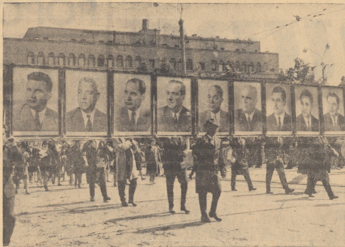
Purtînd cu bucurie portretele conducătorilor iubiți

Se revărsă ca o apă tînră, ca un torent de munte împănate pînă la fund, în care ține limpede chipul ca-ntr-o oglindă, se revărsă clocotitor prin fața tribunei — tinerețea.