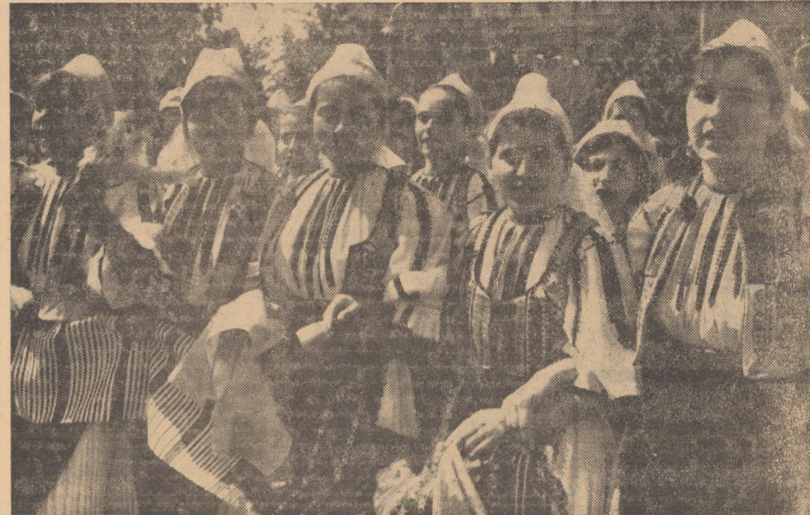
In armoniile exuberante ale costumului sălăștenesc