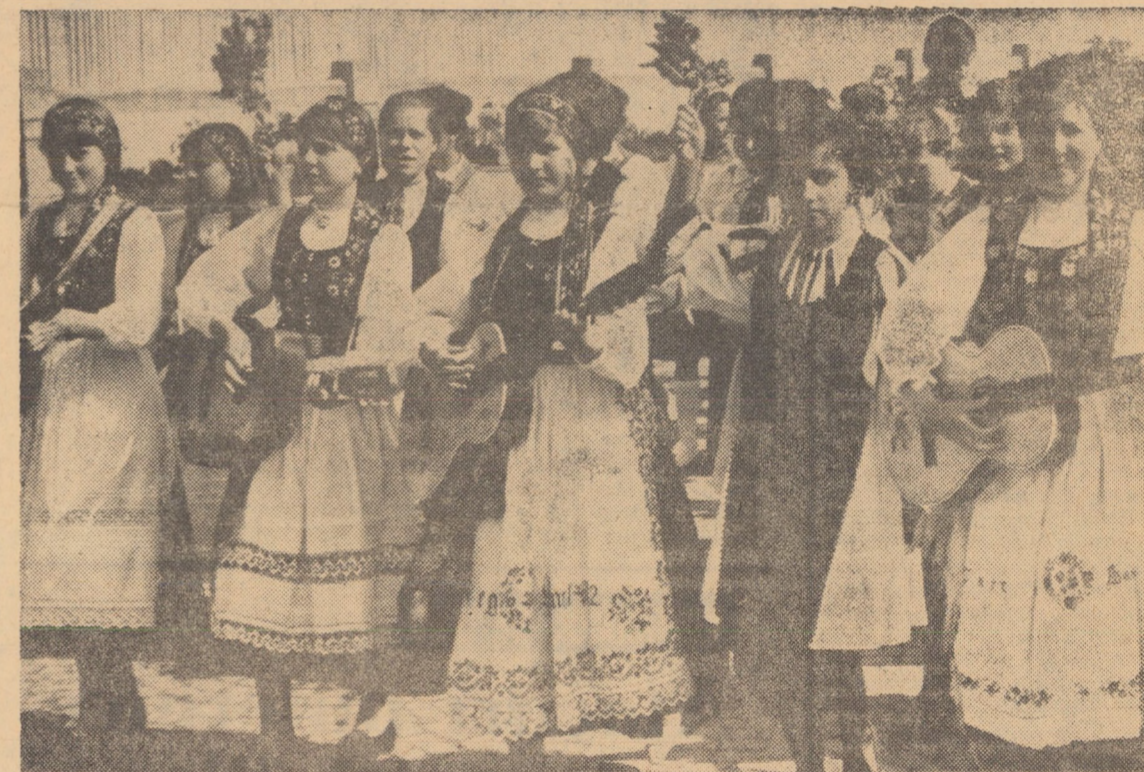
Florile primăvarațice ale costumului sășesc