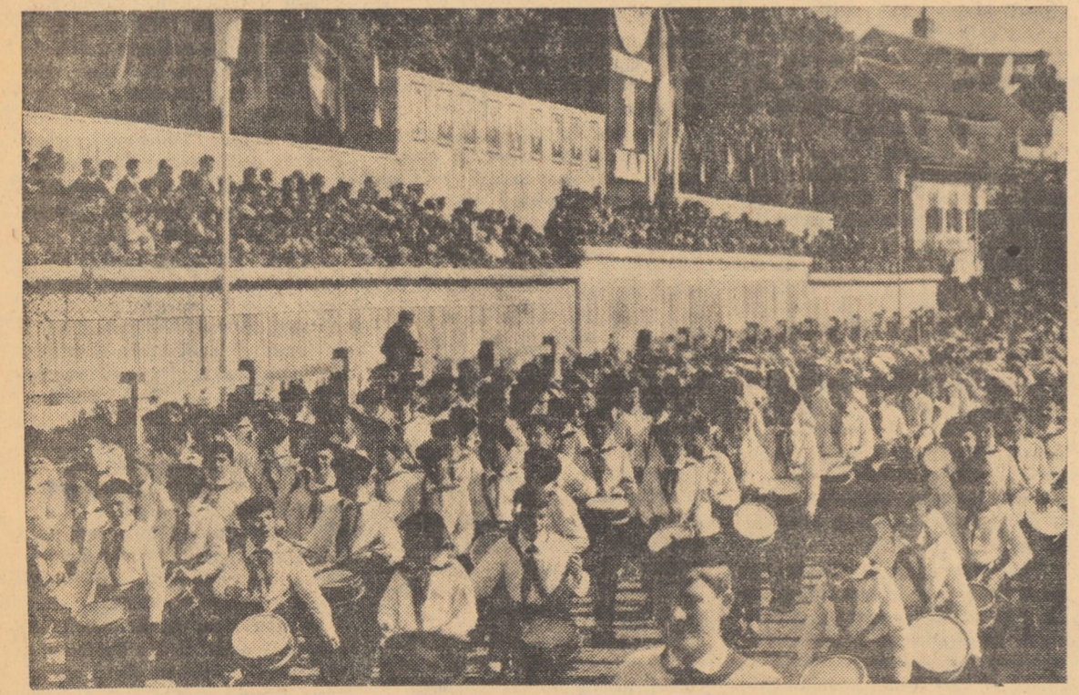
În coloane strîns trec prin fața tribunei oficiale detașamentele entuziaste ale toboșarilor, care fac să răsună piața de bucurie și optimism

Ca niște cercuri delicate trase pe azurul cerului de mai, baloanele colorate slobozite de demonstrații și-au oprit parcă zborul lin să privească scurgerea nesfîrșită a coloanelor, a miilor de oameni ieșiți să sîrbătorească 1 Mai, cea mai frumoasă zi a lui Florad.