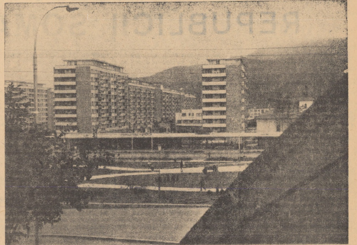
Centrul orașului Piatra Neamt