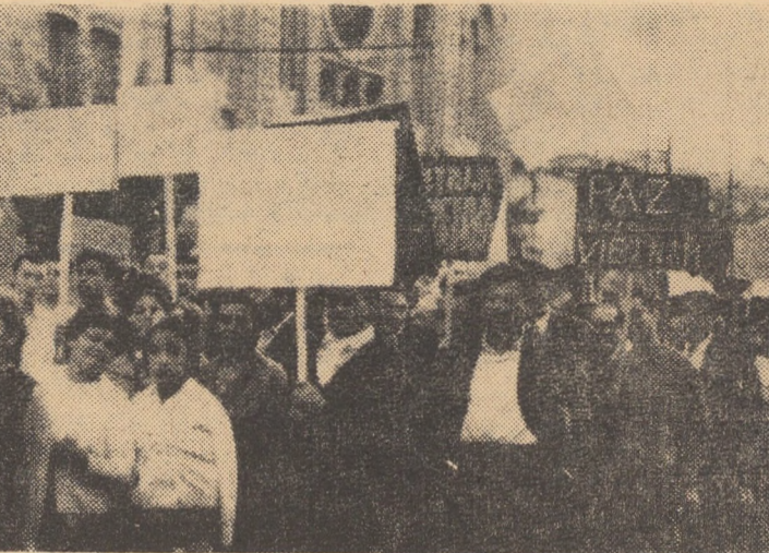
„Poporul chilian este cu Vietnamul!”, „Vietnamul va învinge pe agresorii americani!”, „Pace pentru Vietnam” — cu astfel de lozinci defilează chilienii pe străzile orașelor și satelor...