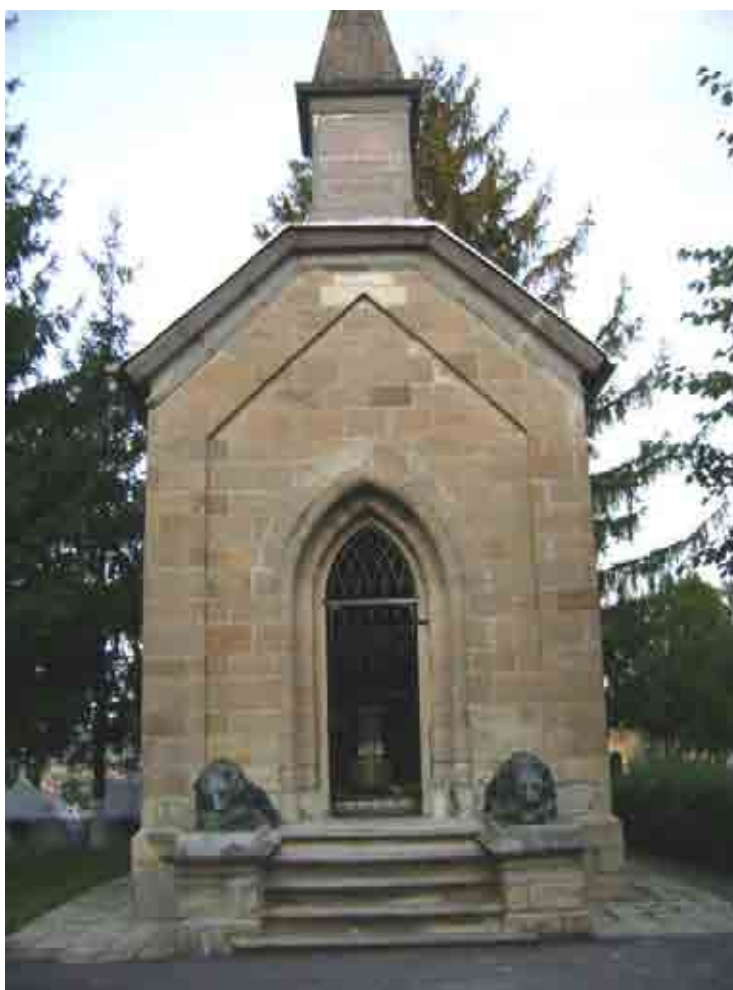
Mausoleul Mitropolitului Șaguna