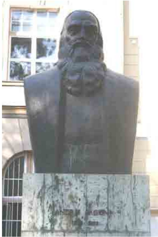
Andrei Şaguna 1808-1873