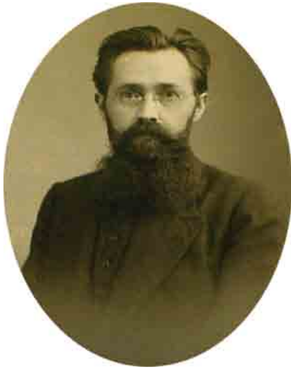
Ion Agârbiceanu 1882-1963