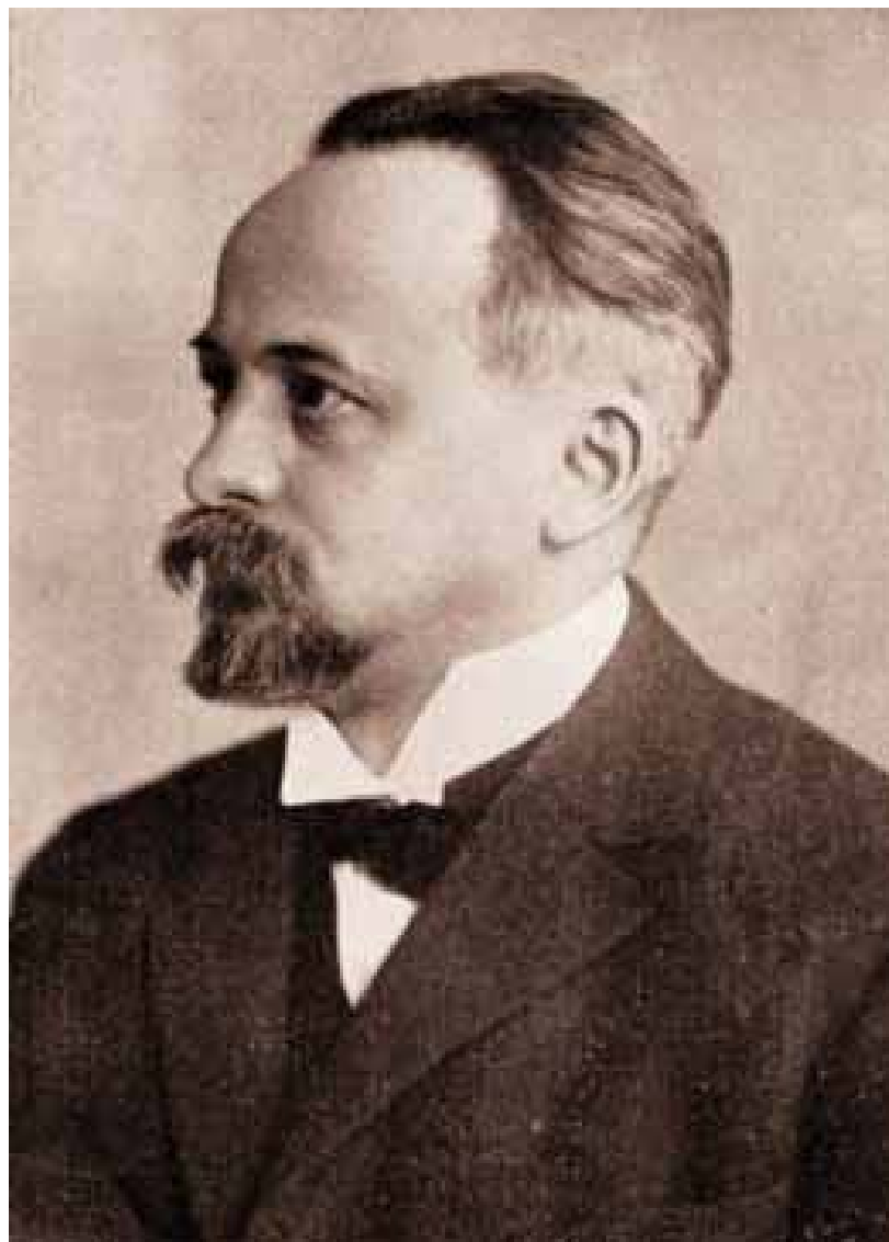
Ioan Lupaș (1880 – 1967)