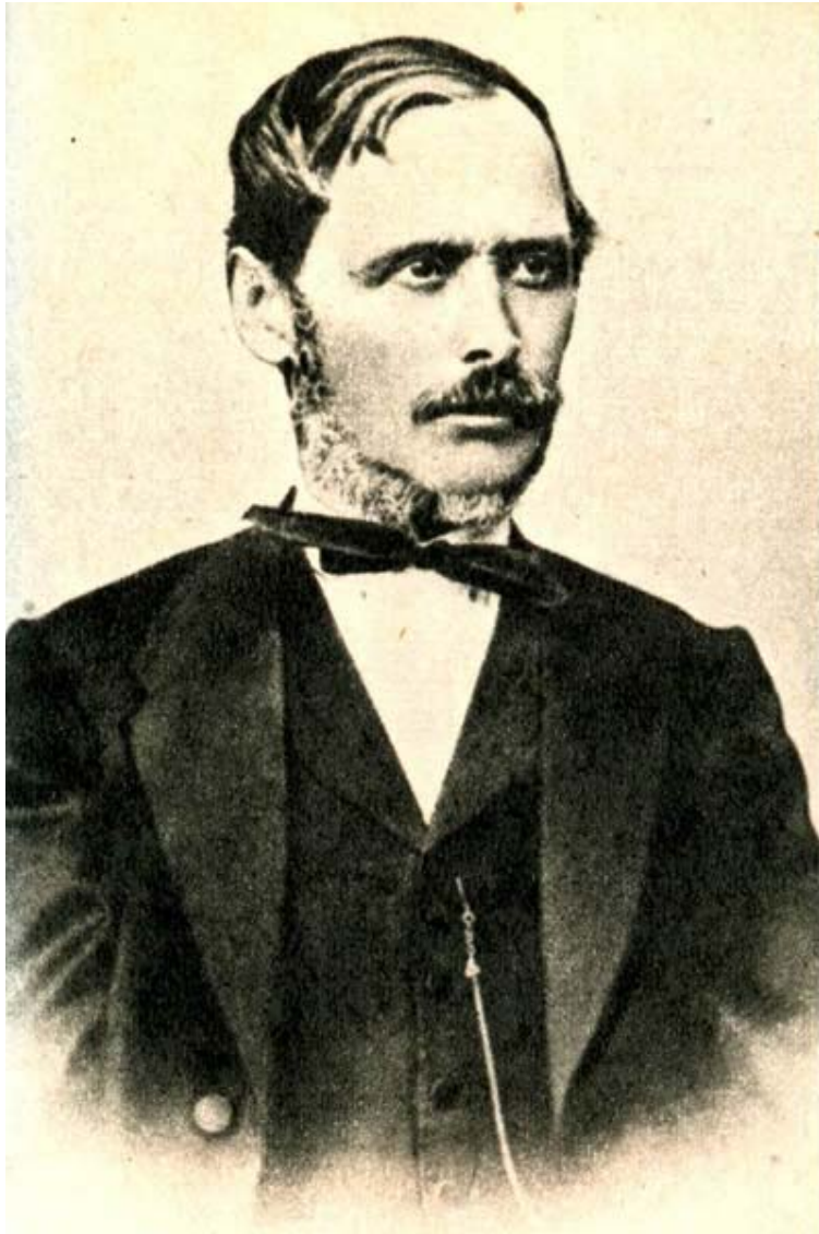
GEROGE BARIȚIU 1812-1893