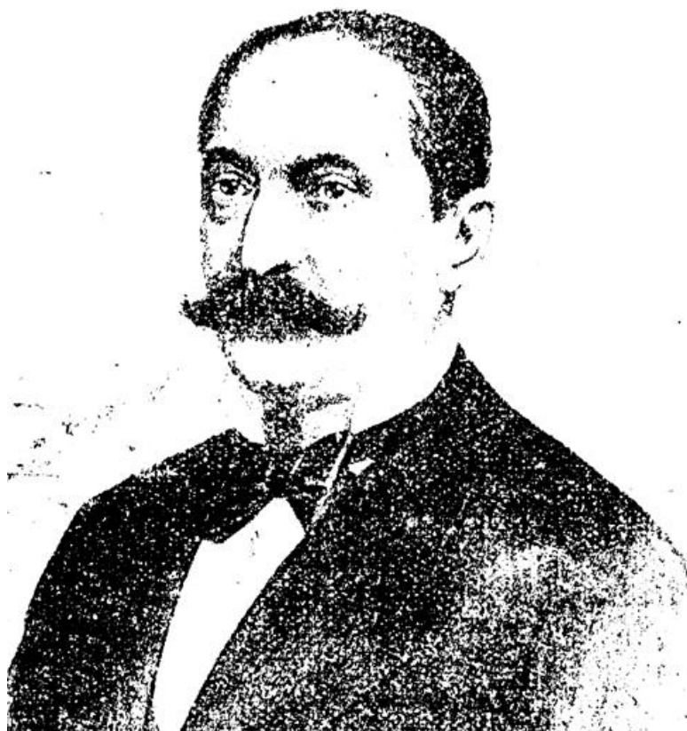
Andrei Bârseanu 1858-1922