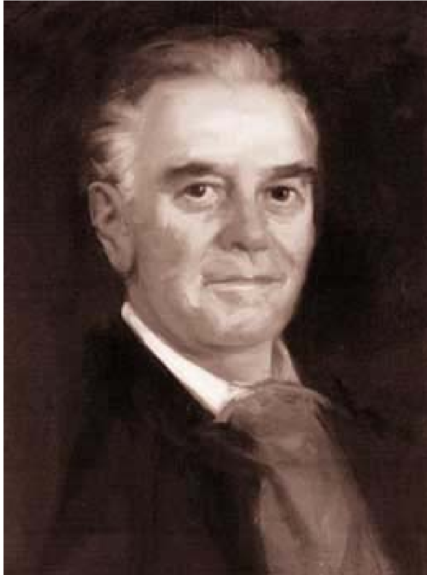
ȘTEFAN PASCU (1914 – 1998)