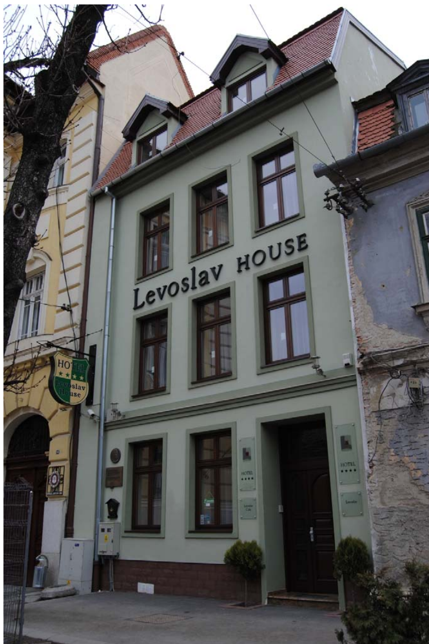
LEVOSLAV HOUSE HOTEL Sibiu, Str.G-ral Magheru nr.12