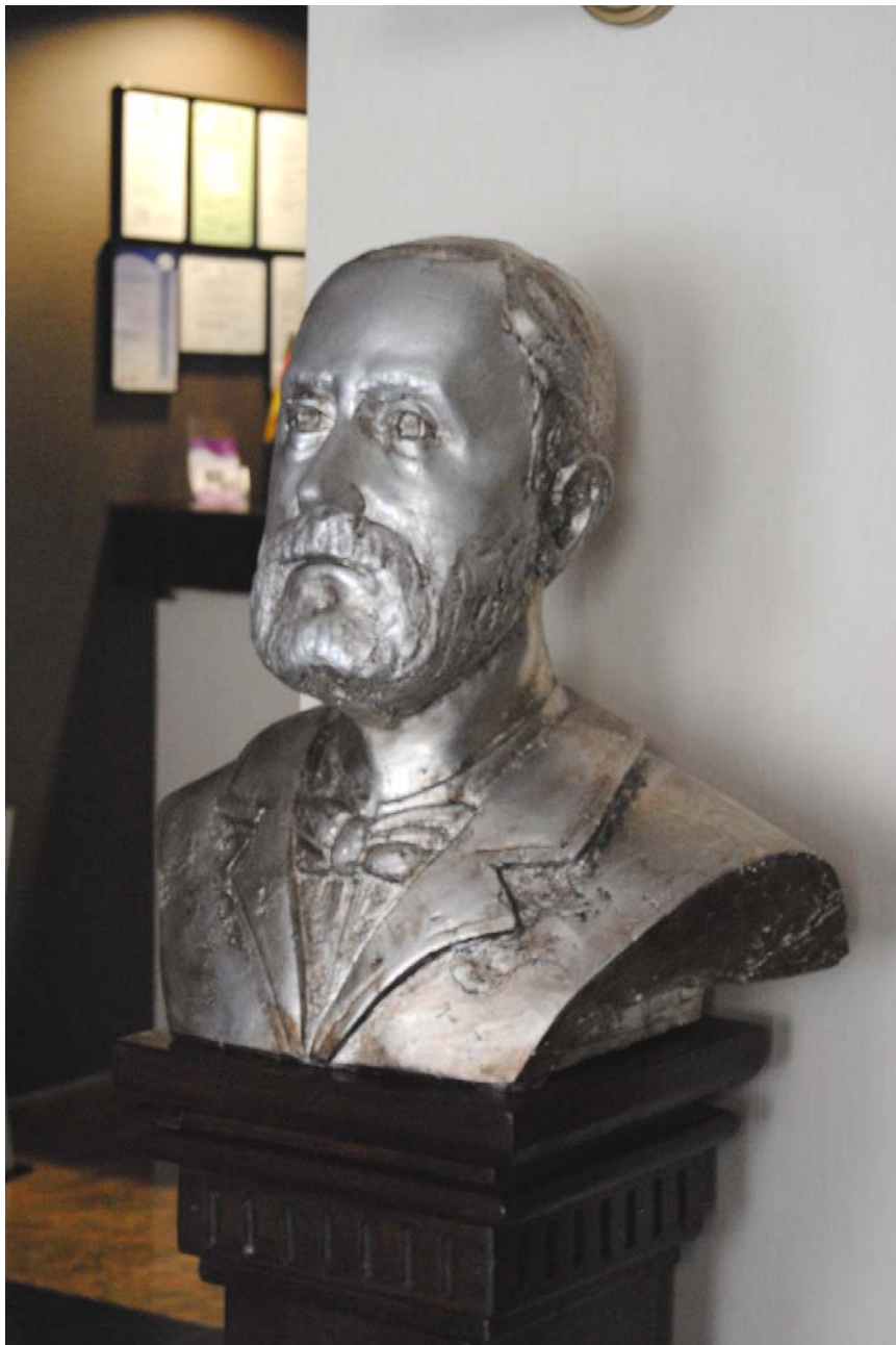
Bust realizat de sculptorul Ioan Căndea și aflat în incinta Hotelului Levoslav House, Str.G-ral Magheru nr.12, Sibiu