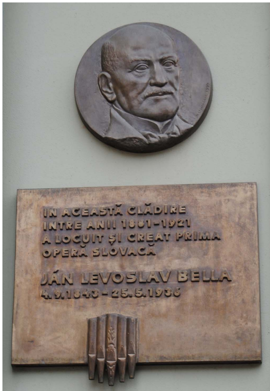
LEVOSLAV HOUSE HOTEL Sibiu, Str.G-ral Magheru nr.12 Altorelieful și bustul sunt realizate de sculptorul Ioan Cănda.