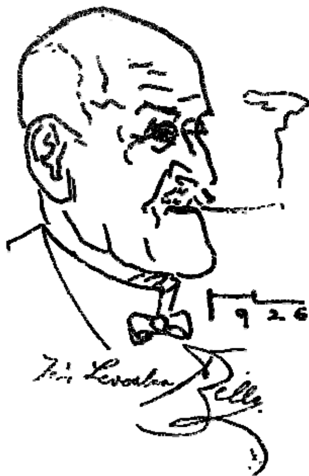
Jan Levoslav Bella (1843-1936)