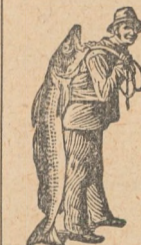
Veritabil numai această marcă — Pescarul — că e m'ntr'garant al experienței lui SCOTT.

nutresc oasele, le fac tari și drepte și fac posibilă dezvoltarea unei carni sănătoase și bune.