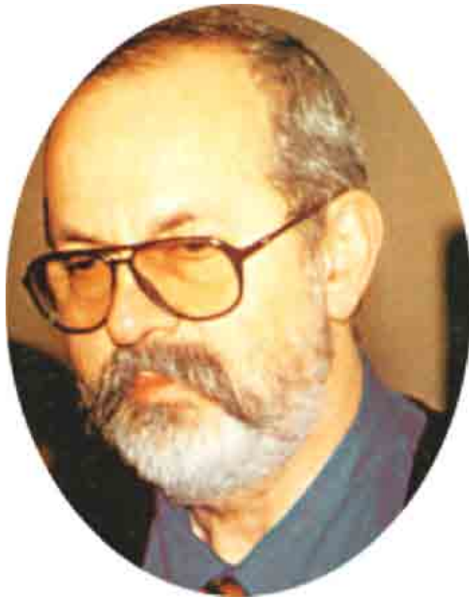
Horia Bernea (1938 – 2000)