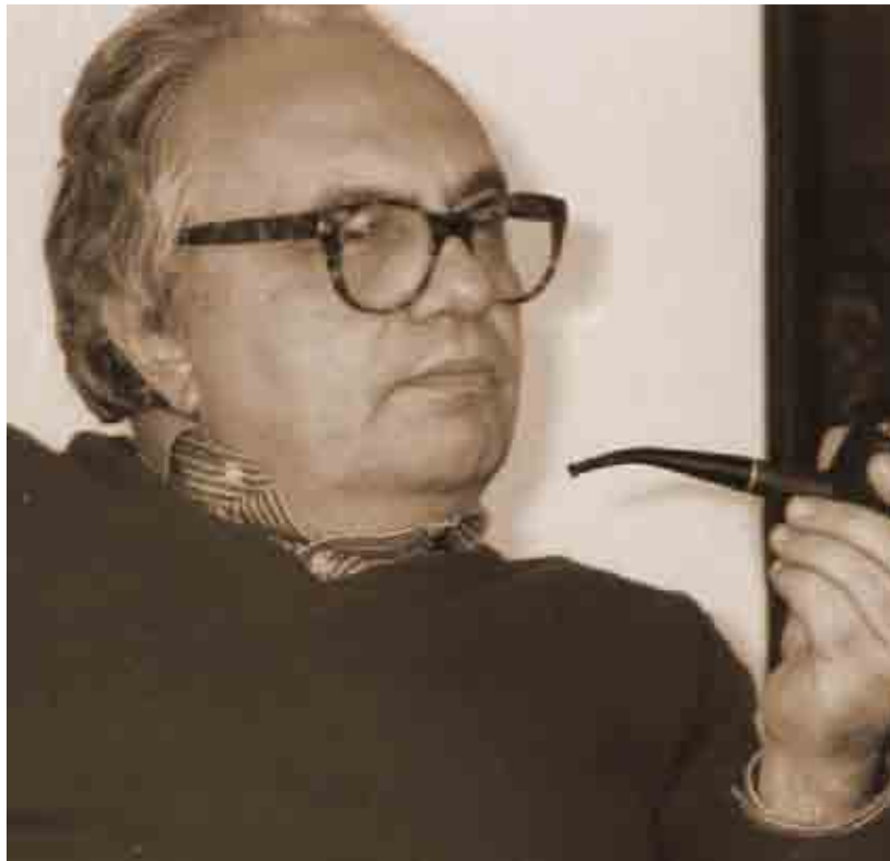
acad. Basarab Nicolescu (1942)