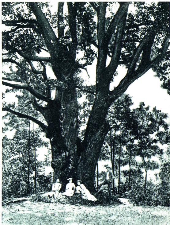
Stejarul de mie ani — Az ezer éves tölgy