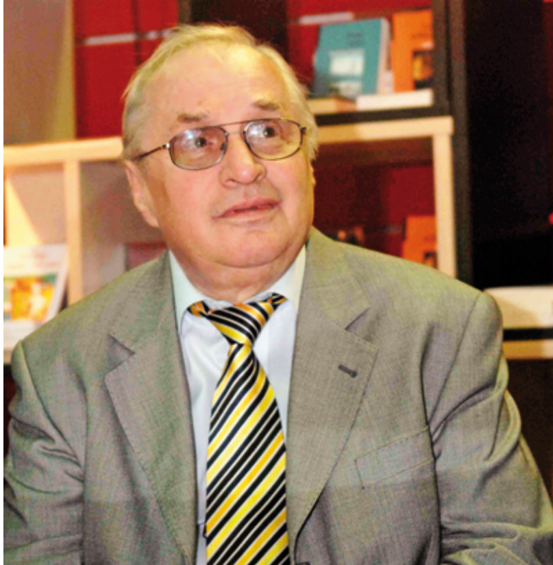
Augustin Buzura (n. 1938)