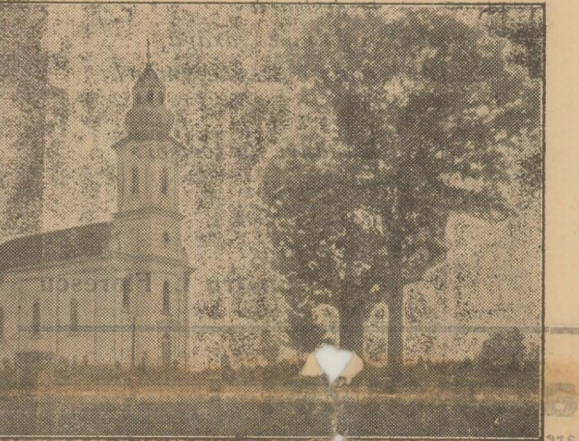
BISERICA DIN TEBEA

în care îmi îndeplinesc misiunea de apostol al culturii sânt așezat în apropierea acestor izvoare, am avut fericirea de a primi pe acești exploratori și descoperitori de finuturi și caractere etnice