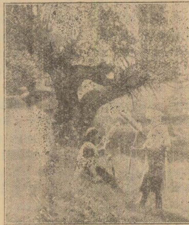
Locuitori din comuna Crișan.